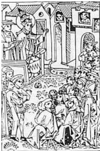
Paus Urbanus II roept te Clermont op tot de eerste kruistocht

Laten we een duizend jaar terug gaan. Terwijl in deze contreien nog slechts sprake kan zijn van een woest landschap en enkele kleine nederzettingen, zijn de kruistochten naar het 'Heilige Land' in volle gang. Niet alleen de strijd om Jeruzalem maar ook de lange, uitputtende tochten onder barbaarse omstandigheden eisten hun tol onder de christenstrijders.