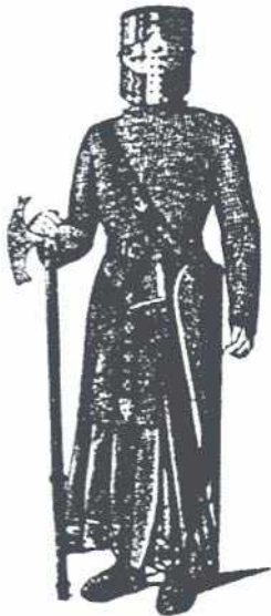
Ridder uit de derde kruistocht, tijdperk Philippe-Auguste (Frankrijk) 1165-1223

Het debacle van deze immense volksverhuizingen was echter het gevolg van het gebrek aan saamhorigheid en een tekort aan mankracht. Voornamelijk de zucht naar macht, die vooral de Paus naar zich toe trok door zich te manifesteren als militair strateeg onder christelijke vlag, heeft de doelstelling danig ondergraven.