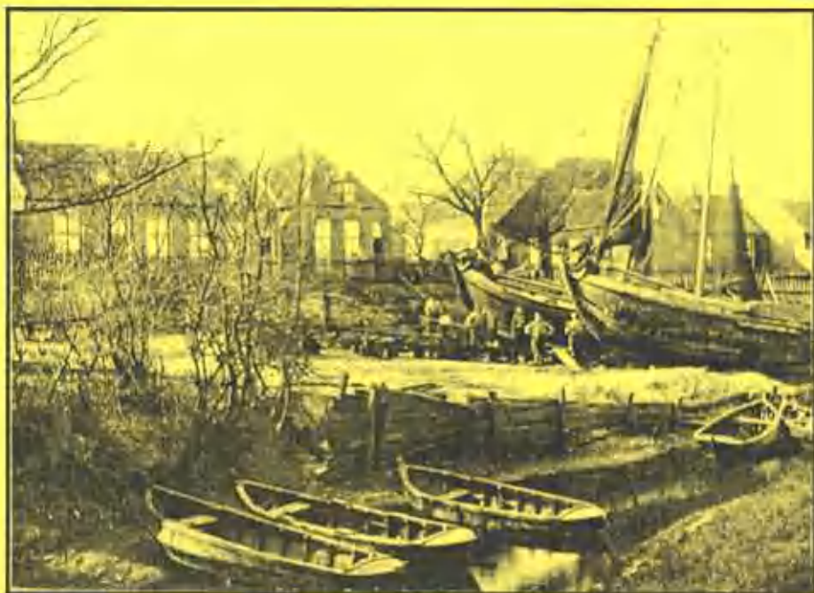
Scheepstimmerwerf op de kop van de haven Iomstreeks 1910.