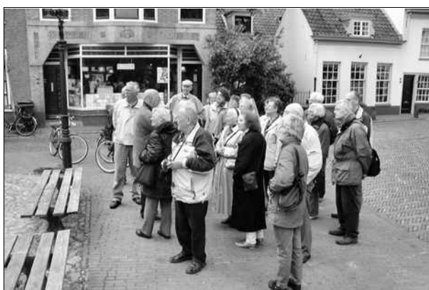
Aandachtig publiek tijdens de stadswandeling

Alle foto's zijn op het internet te zien op internet: http://home.hccnet.nl/k.c.uittien/excursie/index.html