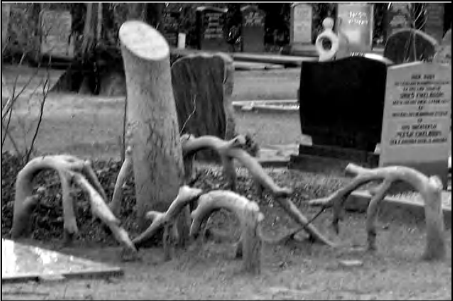
Het nog steeds bestaande graf van Woutje van der Velde

Excessen blijven verder gelukkig een uitzondering. .