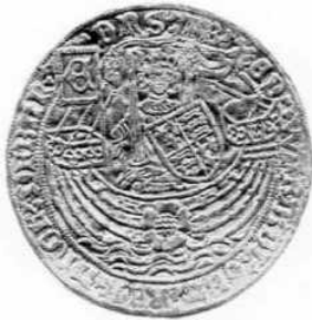
voorzijde ware grootte