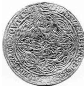
keerzijde ware grootte

In 1617 heeft de dichter, toneelschrijver en historicus P.C. Hooft geschreven: “Die niet en heeft magh niet te werk gaen of ‘t rozenobels zou regenen” , wat geen nadere toelichting behoeft en ook tegenwoordig zeker nog behartigenswaardig is.