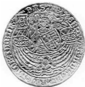
voorzijde ware grootte