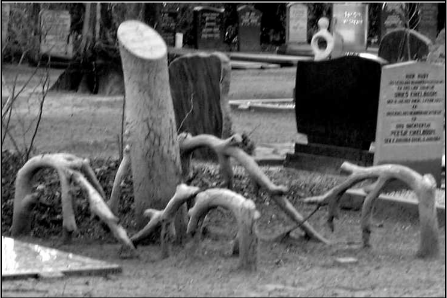
Het nog steeds bestaande graf van Woutje van der Velde

Excessen blijven verder gelukkig een uitzondering. .