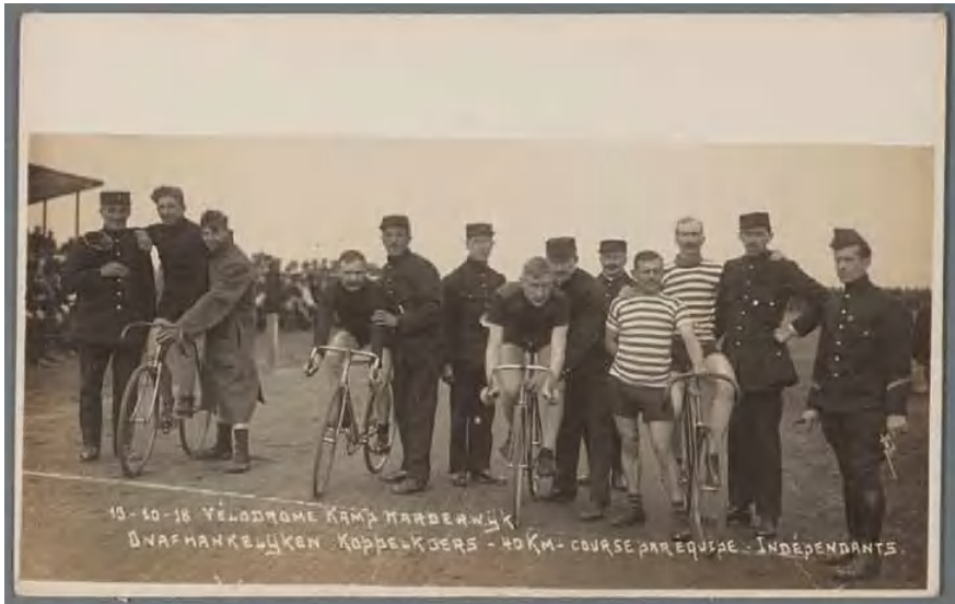
Velodrome Belgenkamp , gefotografeerd door C. Du Houx 1918

In het Harderwijkse kampblad INTER NOS REVUE, dat in twee talen verschijnt: het Vlaams en het Waals, wordt in de eerste editie op 1 juni 1916 geschreven: "sport onderhoudt ons lichaam en bewerkt eenen gezonden geest". Velen houden zich dagelijks bezig met gymnastiek, atletiek, dammen, schaken, voetballen, wielrennen, kaatsen, etc. Opvallend is hierbij dat de Walen zich vooral toeleggen op het kaatsen, terwijl de Vlamingen zich richten op voetballen en wielrennen. Voor de laatste tak van sport legt men zelfs een heuse wielersbaan aan. Overigens beperkt het verschil tussen Vlamingen en Walen in Harderwijk zich alleen hiertoe. In Nunspeet is dat onder de burgervluchtelingen wel anders. Iets wat door de Nunspeters niet echt wordt begrepen: "Het zijn toch dezelfde vluchtelingen uit hetzelfde land?"