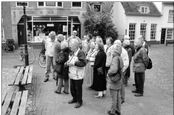
Aandachtig publiek tijdens de stadswandeling

Alle foto's zijn op het internet te zien op internet: http://home.hccnet.nl/k.c.uittien/excursie/index.html