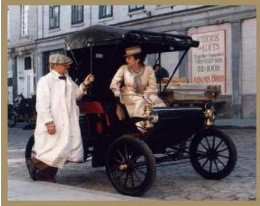
Oldsmobile uit 1904

"De snelheid van een automobiel kan duizelingwekkend zijn en geeft in dit opzicht een beeld van het gejaagde leven en den strijd om 't bestaan.