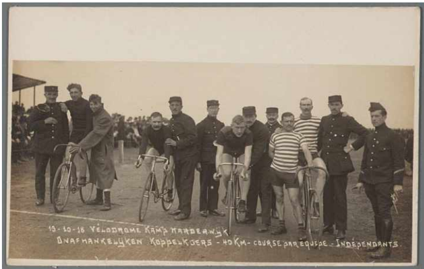
Velodrome Belgenkamp 1918

In het Harderwijkse kampblad INTER NOS REVUE, dat in twee talen verschijnt: het Vlaams en het Waals, wordt in de eerste editie op 1 juni 1916 geschreven: "sport onderhoudt ons lichaam en bewerkt eenen gezonden geest". Velen houden zich dagelijks bezig met gymnastiek, atletiek, dammen, schaken, voetballen, wielrennen, kaatsen, etc. Opvallend is hierbij dat de Walen zich vooral toeleggen op het kaatsen, terwijl de Vlamingen zich richten op voetballen en wielrennen. Voor de laatste tak van sport legt men zelfs een heuse wielersbaan aan. Overigens beperkt het verschil tussen Vlamingen en Walen in Harderwijk zich alleen hiertoe. In Nunspeet is dat onder de burgervluchtelingen wel anders. Iets wat door de Nunspeters niet echt wordt begrepen: "Het zijn toch dezelfde vluchtelingen uit hetzelfde land?"