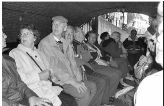
In de boot, onder de eerste brug.