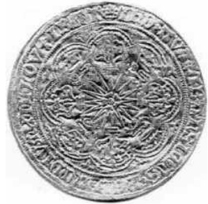
keerzijde ware grootte

In 1617 heeft de dichter, toneelschrijver en historicus P.C. Hooft geschreven: “Die niet en heeft magh niet te werk gaen of ‘t rozenobels zou regenen” , wat geen nadere toelichting behoeft en ook tegenwoordig zeker nog behartigenswaardig is.