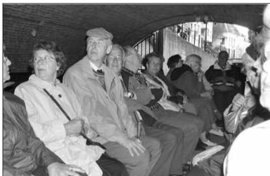
In de boot, onder de eerste brug.