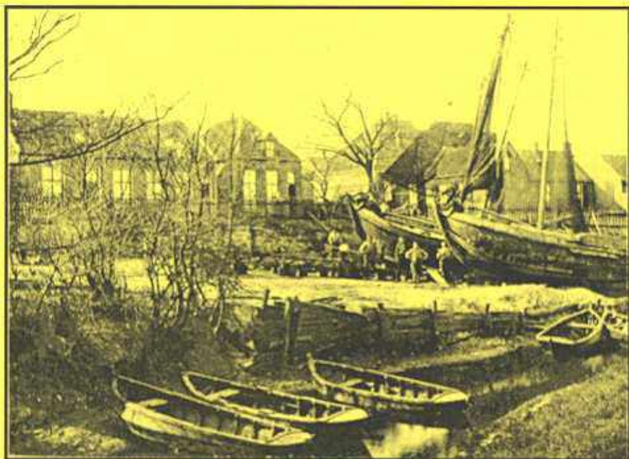
Scheepstimmerwerf op de kop van de haven (omstreeks 1910)