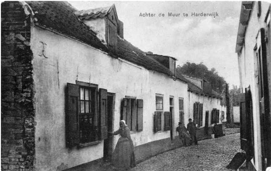
ansichtkaart uit de collectie van het gemeentearchief