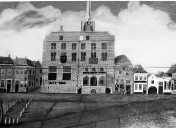
De Broeders met linksvoor “de paeltjes” en een glimp van de pomp