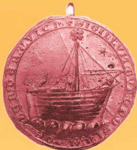
Zegel van de kooplieden van Harderwijk uit 1262 Randschrift: "sigillum burgensium de herderuvich"