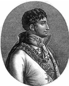
Koning Lodewijk Napoleon (1778-1846)