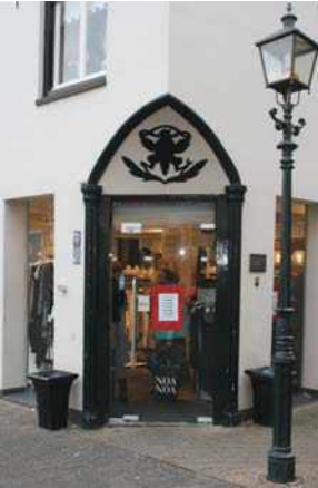
Entree huidige winkel (25-1-2008)

kwam vragen waarom dit symbool het hoekpand Bruggestraat, Markt opsierde. Hij had namelijk het symbool van zijn land herkend.