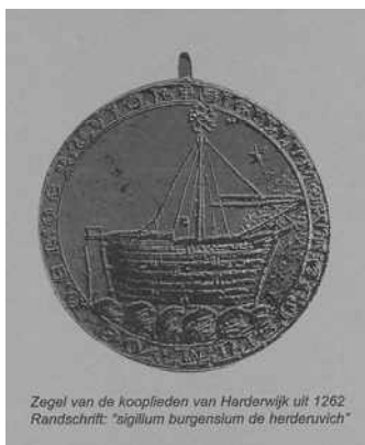
Zegel van de kooplieden van Harderwijk uit 1262. Randschrift: "sigillum burgensium de herderewich"