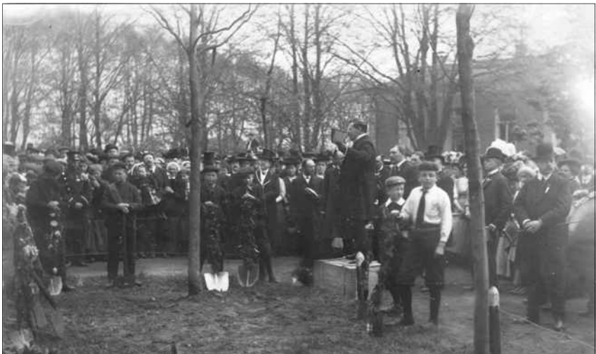
Het planten van bomen ter gelegenheid van Koninginnedag 1908