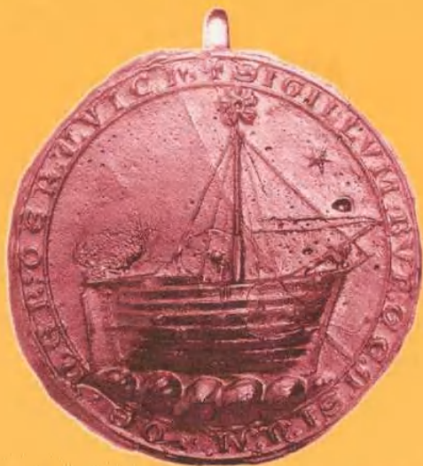
Zegel van de kooplieden van Harderwijk uit 1262 Randschrift: "sigillum burgensium de herderuvich"