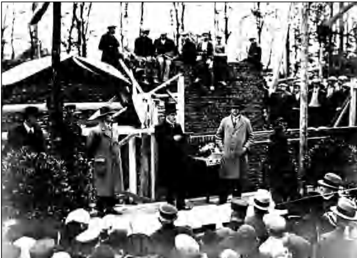
De eerste steenlegging op 20 oktober 1932 .

Harderwijk is rijk aan kerkgebouwen. Mooie kerken zijn echter betrekkelijk schaars. Met kop en schouders steekt uiteraard de Grote Kerk er bovenuit, op de voet gevolgd door de Catharinakapel. Anderen zullen wellicht de volgorde omdraaien. Mooi is immers een uiterst subjectief criterium. Niemand echter zal betwisten dat Grote Kerk en Catharinakapel dé monumentale kerkgebouwen van Harderwijk zijn. Wie de nummer drie op deze lijst is, valt moeilijk vast te stellen. Wel is het een feit dat de Plantagekerk tot de markante kerkgebouwen van Harderwijk behoort. De Plantagekerk heeft de uitstraling van een echte stadskerk en bepaalt nadrukkelijk de omgeving van de Smeepoort. Ook dit kerkgebouw heeft de status van rijksmonument, al is het slechts vijfenzeventig jaar oud. Uniek in Nederland is de Plantagekerk niet. Onder andere in Alkmaar en Goes staan vrijwel identieke kerken.