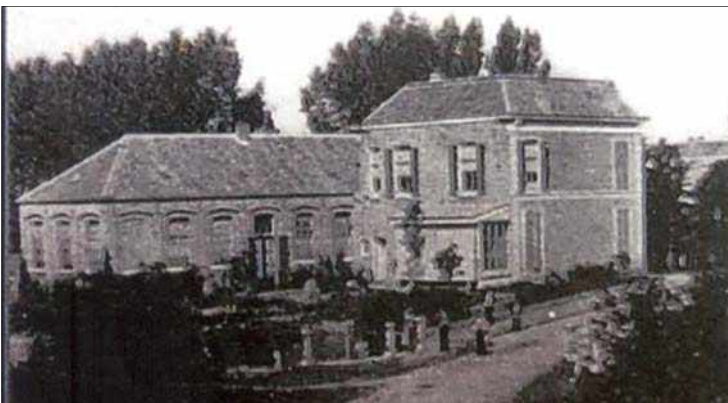
Huis en drukkerij te Wageningen