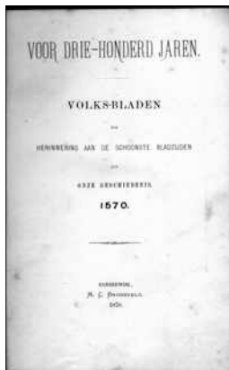
Titelblad Voor drie-honderd jaren