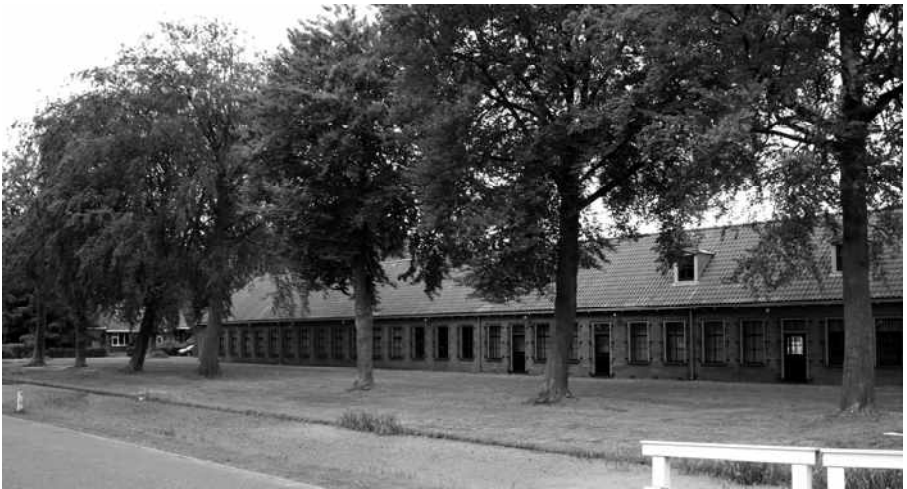
Het derde gesticht, thans het onderkomen van het Gevangenis­museum

Inmiddels gaat het met de steun voor het project in Harderwijk niet geweldig. Waren er bij de start in 1818 nog 64 Harderwijkers die een stuiver per week opzij legden ten behoeve van de landbouwkoloniën, in 1825 zijn dat er nog maar tien. Na dat dieptepunt trekt het weer een beetje aan. Burgermeester Van Meurs wordt voorzitter van de subcommissie en onder zijn leiding stijgt het ledental naar rond de twintig. Daar zal het de hele eerste helft van de negentiende eeuw rond blijven