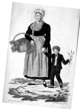
De uniforme kleding voor de bewoners van de Koloniën van Weldadigheid. Men moest ze wel zelf betalen