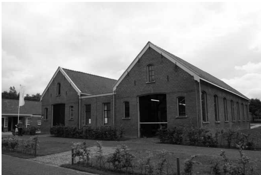
Gerestaureerde gebouwen van de voormalige kolonie in Veenhuizen