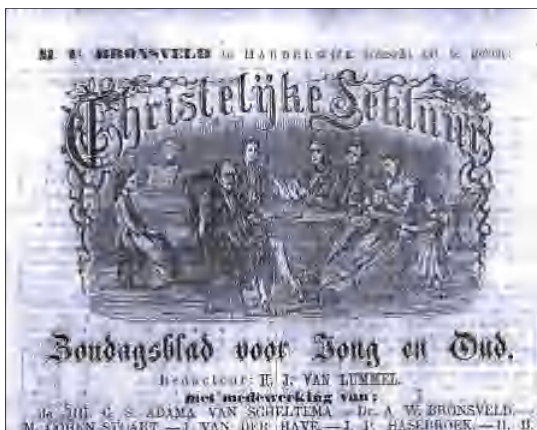
Advertentie voor het zondagsblad voor jong en oud