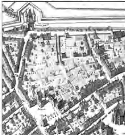
Kaart 1649 HORTUSPATK