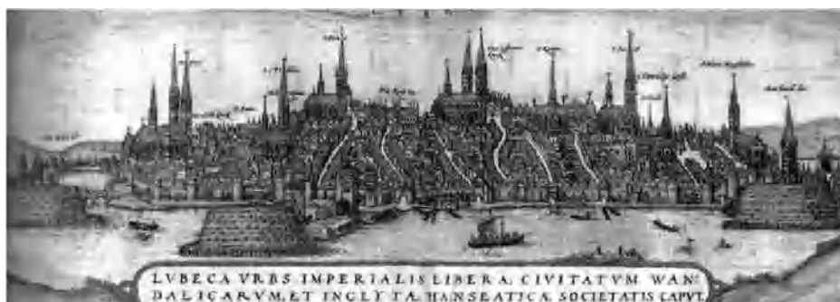
Lübeck in de late middeleeuwen