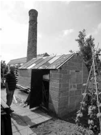
Ketelhuis met schoorsteen