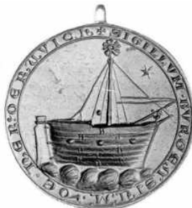
Stadszegel van Harderwijk