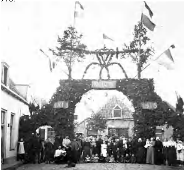
Prinspoort te Harderwijk, maar waar?

Op vrijdag in de loop van de ochtend beginnen de spelen voor de diverse leeftijden en de animo om mee te doen is groot. Deze buitenactiviteiten mogen zich in mooi weer verheugen én in een grote belangstelling, want tijdens de spelen maken de straten van de stad een uitgestorven indruk, zo vindt de krant. Veel winkels hebben de achterliggende weken reclame gemaakt voor uiteenlopende feestartikelen, van vlaggen en crêpepapier tot een Onafhankelijkheidsspel en Bengaals vuur. De Fa. Ten Broek leverde ook kant en klare versieringen en bij P. Raaijen was tegen een billijke prijs illuminatie per meter te koop. De Grote Bazar van de Fa. wed. H. Karssen op de Markt adverteerde met een prachtig afgewerkte goud- en zilverkleurige gedenkpenning voor de prijs van 15 cent, met een aanzienlijke korting bij afname van meer dan 100 exemplaren. En bij Boekhandel W. Wielenga waren één dag na het feest uit een sortering van 50 stuks al diverse kaarten in voorraad souvenir aan deze feestweek begin september 1913.