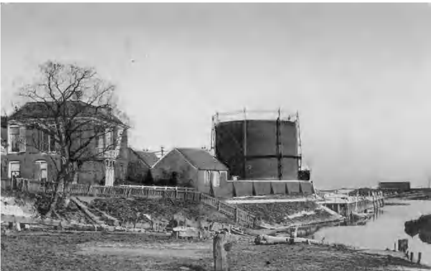
Gasfabriek Harderwijk met links de directeurswoning (ansicht gemeentearchief, ca. 1915)

In 1912 worden de gaslantaarns voorzien van een automatische ontsteking; dit moet een belangrijke bezuiniging opleveren: "Lantaarns opsteken en blussen, schoonmaken en kousjes vervangen kost wel fl. 670.- per jaar!"