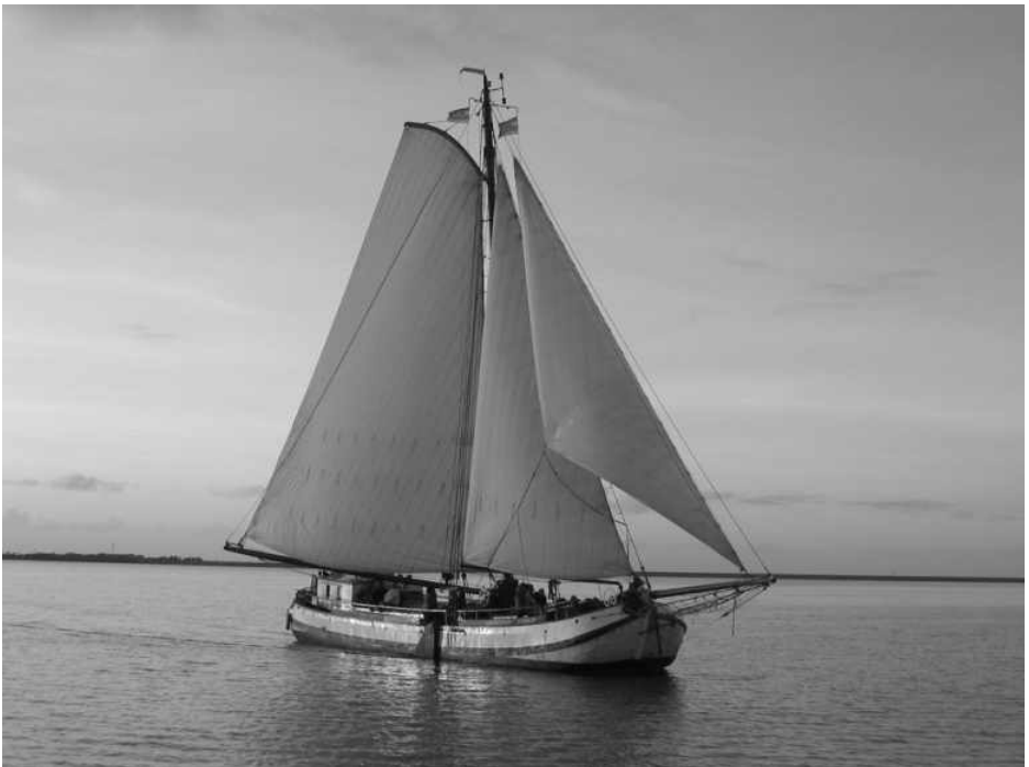
Voorbeeld van een Friese tjalk

een overdekte Friese tjalk met toebehoren, als 3 ankers, ketting, stand en lopend want, span zeilen, fok, 2 kluiffokken, haken, bommen enz. liggende in de haven alhier.