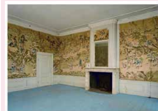
Per 1 juli 2016 zal Nederland een nieuwe wet hebben: de Erfgoedwet. Deze wet zal onder andere de Monumentenwet 1988 (Mw 1988) en de Wet behoud cultuurboort (Wbc) gaan vervangen. Nieuw in de Erfgoedwet is dat nu ook een interieur in samenhang met een rijksmonument kan worden aangewezen als ensemble. Het geheel van rijksmonument, interieur en de losse interieuronderdelen of cultuurobjecten moeten samen wel van bijzondere cultuurhistorische of wetenschappelijke betekenis zijn. De minister houdt een informatiesysteem van aangewezen ensembles bij.

Fotokijkavond o.l.v. de werkgroep Hierden Dorpshuis Hierden, zaal open 19.30 uur.