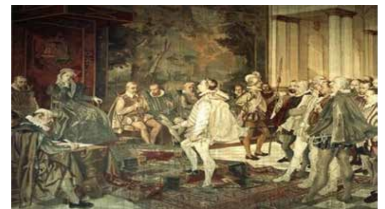
Aanbieding van het Smeekschrift door Hendrik van Brederode aan landvoogdes Margaretha van Parma (wandtapijt, Stadsmuseum Brussel). Hendrik van Brederode was, met Willem van Oranje, één van de leidende edelen van de opstand in de Nederlanden. In het smeekschrift wordt gevraagd om afschaffing van de 10e penning en om godsdienstvrijheid