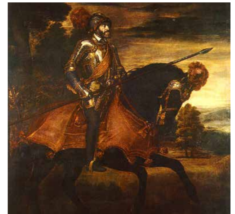
Karel V, Slag bij Mühlberg, 1548 (Titiaan, Museo del Prado, Madrid)

zestiende eeuw trof men andere bestuursstructuren aan dan bij andere, Europese mogendheden. Waar elders in Europa vorsten steeds meer macht naar zich toe trokken, bleef er in de Nederlanden tot het begin van de zestiende eeuw een 'middeleeuwse' situatie bestaan. Van de Nederlanden als een collectivum was nog geen sprake tot 1543. Lokale bestuurders hadden veel ruimte om hun eigen beleid te bepalen en bewaakten die eigen ruimte ook fel.