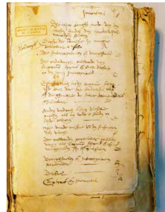
Eerste pagina van het dossier Harderwijk van de Raad van Beroerten

veel mogelijk belastend materiaal te verzamelen, zoals ook gebeurd is in Harderwijk op last van de landvoogdes. Toen Alva merkte dat de onderzoeken maar moeizaam vorderden en velen gealarmeerd het land ontvluchtten, stelde hij begin 1568 nieuwe instructies op. De aandacht werd nu verlegd naar gevluchte personen en het opstellen van overzichten van hun achtergebleven goederen 30 .