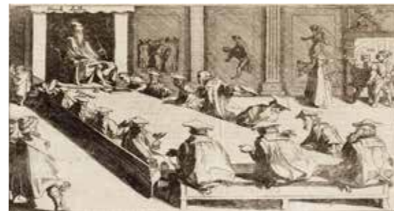
Alva en Raad van Beroerten