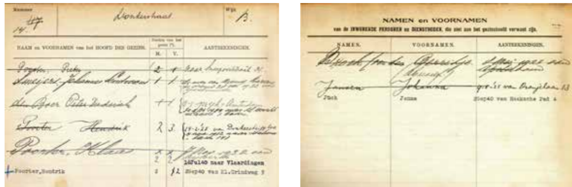
Voorbeeld van de voor- en achterkant van zo'n woningkaart