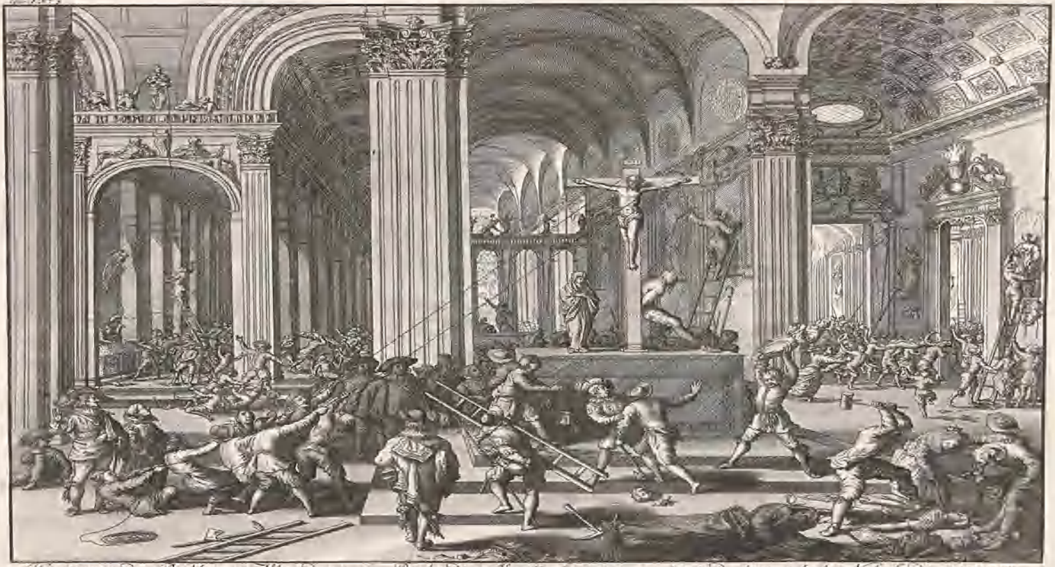
De stormen der Beelden, en Vlaanderen en Brabant 16. 1685. begonnen, en verstoend door geheel Nederland verspreet.