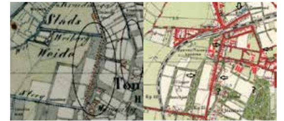
Kaartje links laat de mogelijke bovenstroomse trajecten zien van de Onderste Sypel (links) en de Bovenste Sypel (rechts); (de kadasterkaart 1830-50). Kaartje rechts laat de topografische kaart van 1957 zien, waarin de gelijkenis van de vorm van de strook Slingerlaantje en het centrale deel van het Slingerbos zichtbaar zijn.

Het behoort ook tot de mogelijkheden dat het oorspronkelijke tracé van de Onderste Sypel niet de Oranjelaan volgde, maar het iets oostelijker gelegen Slingerlaantje (zie bijgaande kaart uit 1830). Het idee van de slingerstrook van het Slingerlaantje is later geïmiteerd in het westelijker gelegen Slingerbos. Opvallend op de topografische kaart van 1830 is ook de naam 'Waterplas' aan de onderkant. Gezien de hoogtelijnen lijkt een westelijker drainage langs de Weisteeg echter aannemelijker dan één richting het noorden naar de Onderste Sypel.