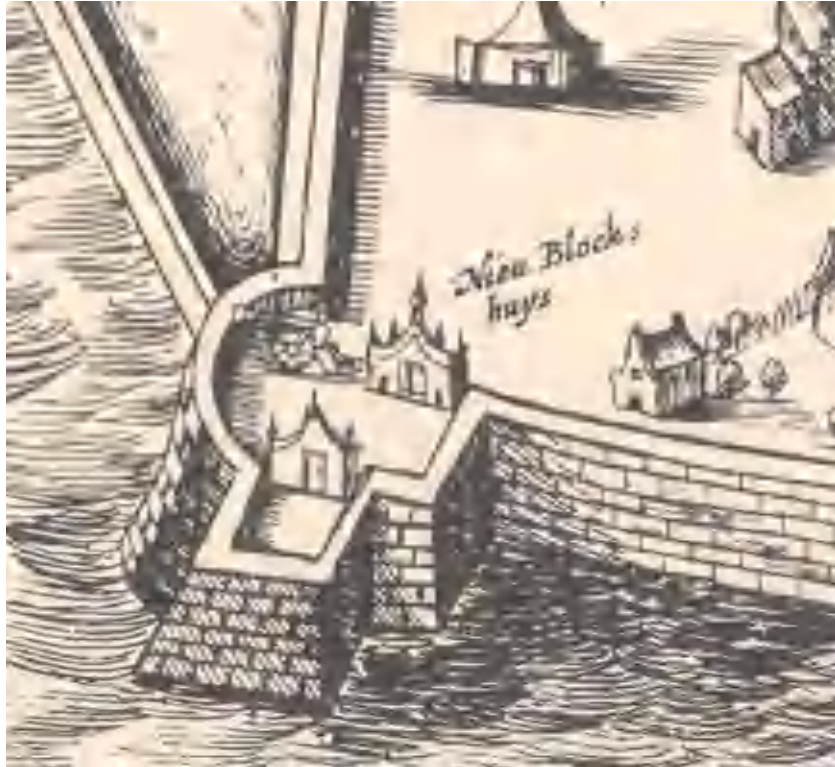
Het bastion op de kaart van Nicolaes van Geelkercken uit 1639