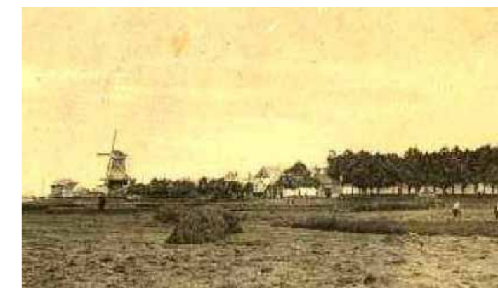
De oude stadsweiden (Voorste Wei) met links nog de langs de Stationslaan staande koren molen (de bomenrij markeert de Weibeek).

De Weibeek ontsprong in de stadsweiden ten zuiden van het stadscentrum op de plaats waar nu de kassen staan tussen de Rietmeen en de snelweg. De beek stroomde parallel aan de kust naar de stadsgracht in het huidige Plantagepark. De huidige stadsvijvers volgen nog voor een deel de oude loop, maar de voormalige bovenloop is inmiddels aangesloten op de ontwatering langs de Rietmeen richting Wolderwijd 5 . De beek vindt mogelijk zijn oorsprong op de plek waar het dekzand onder de afdekkende kleilaag wegduikt 6 . In de 18 e eeuw werd op de locatie van de huidige villa 'Weiburg' een molen gebouwd waar papier werd gezeefd en later olie werd geperst. Onduidelijk is of dit een windmolen of een watermolen betrof.