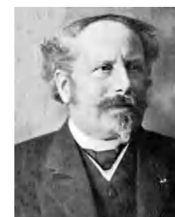
Cornelis Lely (Amsterdam, 1854 – Den Haag, 1929).

*Toegang gratis, aanmelden niet verplicht, maar wel aan te raden: info@catharinakapel.nl