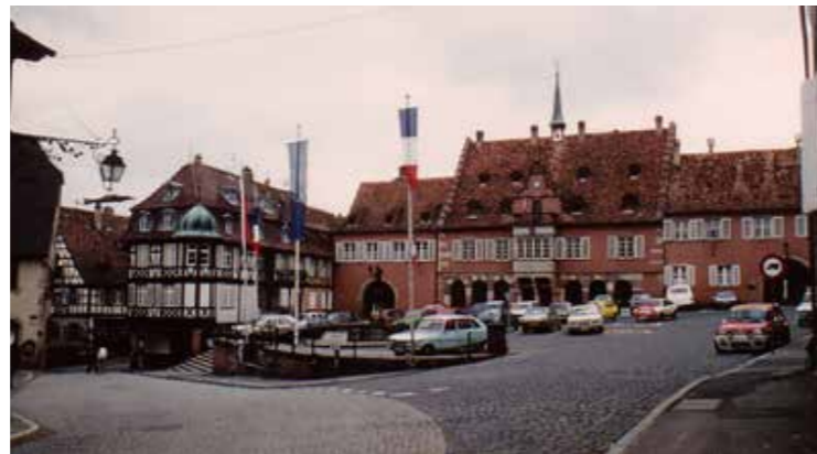
Het gemeentehuis van Barr in 1980