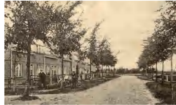
Oude ansichtkaart van de Graaf Ottolaan, hoek met de Prins Frederik Hendriklaan richting het noorden (het spoor). Rechts is een bruggetje zichtbaar.

De Sypelbeek, ook wel 'Sypeltje' genoemd, ontsprong ten Zuidoosten van het stadscentrum aan de rand van het buurtschap Tonsel. De Sypel zou ook als 'stadsbeek' door het oude centrum hebben gestroomd 4 . De oude kadasterkaarten van 1811-32 en 1830-50 laten twee beken zien: de Onderste Sypel die langs de Oranjelaan/Stationslaan stroomde en ergens bij de kruising met de A28/Weisteeg ontsprong en de Bovenste Sypel die ontsprong rond de kruising Graaf Otto- laan/Boerhavelaan en naar de stad liep langs de huidige straat De Sypel en de groene long langs het Hoge Pad. Beide beken zijn bij de aanleg van de spoorweg rond 1850 flink ontregeld. Toch zijn ze nog steeds in het stadslandschap herkenbaar. De Bovenste Sypel is zichtbaar als de groene long tussen de Smeepoort en de Boerhavelaan. Ze zou zelfs nog zuidelijker kunnen zijn ontstaan, waar nu nog de fontein en de 'hoge vijver' langs het Engelserf liggen in het verlengde van de 'Lindenlaan'.