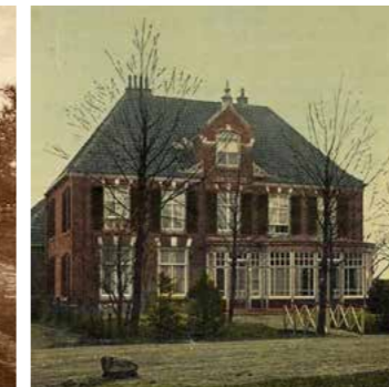
Twee oude foto's nabij de spoorwegovergang bij het station: links de Oranjelaan richting Ermelo met de kwelsloot; rechts de Stationslaan met Villa Wilhelmina met bruggetje, duidend op sloot.

Ook is er aan de directe andere zijde van het spoor een 'bruggetje' waarneembaar dat leidt naar de later afgebroken Villa Wilhelmina.