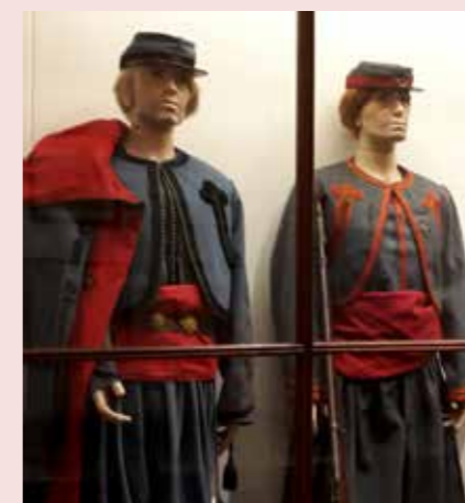
Eigen foto van tentoongestelde zouaven in het Zouavenmuseum te Oudenbosch

De meeste Nederlandse zouaven waren mannen van jonge leeftijd en kwamen voornamelijk uit de zuidelijke provincies, maar uit heel Nederland vertrokken jonge katholieken naar Rome. De reis begon voor de vrijwilliger bij hun eigen pastoor. Die keek of de vrijwilliger capabel en gemotiveerd genoeg was en stuurde hem dan door naar het centraal vertrekpunt. Van 1864 tot 1870 was dat in het Brabantse Oudenbosch. Hier kregen de zouaven training en werden ze voorbereid op hun reis naar Rome. Per trein reisden ze, via Brussel, waar ze werden gekeurd, naar Marseille en vandaar per boot naar Rome. In de kerken werd gecollecteerd ten behoeve van de fondsen voor deze reizen.