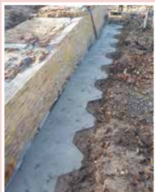
Het resultaat mag er zijn

Beton storten: aan de voet en in de gaten/ sleuven die geboord zijn