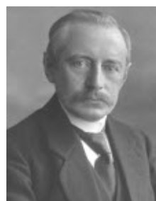
Minister ir. G.J. van Swaaij

In de Tweede Kamer kwam van verschillende zijden kritiek op het wetsontwerp, met name op wat gezien werd als het "schriele optreden tegenover het gerechtvaardigde belang van de vissers". 1 De verantwoordelijke minister, ir. G.J. van Swaaij (Mi-