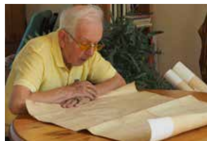
Je springt toch een gat in de lucht als je dit ziet!

Herderewich zal de tekening overdragen aan het Streekarchivariaat, zodat iedereen deze kan raadplegen. Ity, nog welbedankt. We hopen dat veel Harderwijkers je voorbeeld zullen volgen en niet iets waardevols weggoeien.