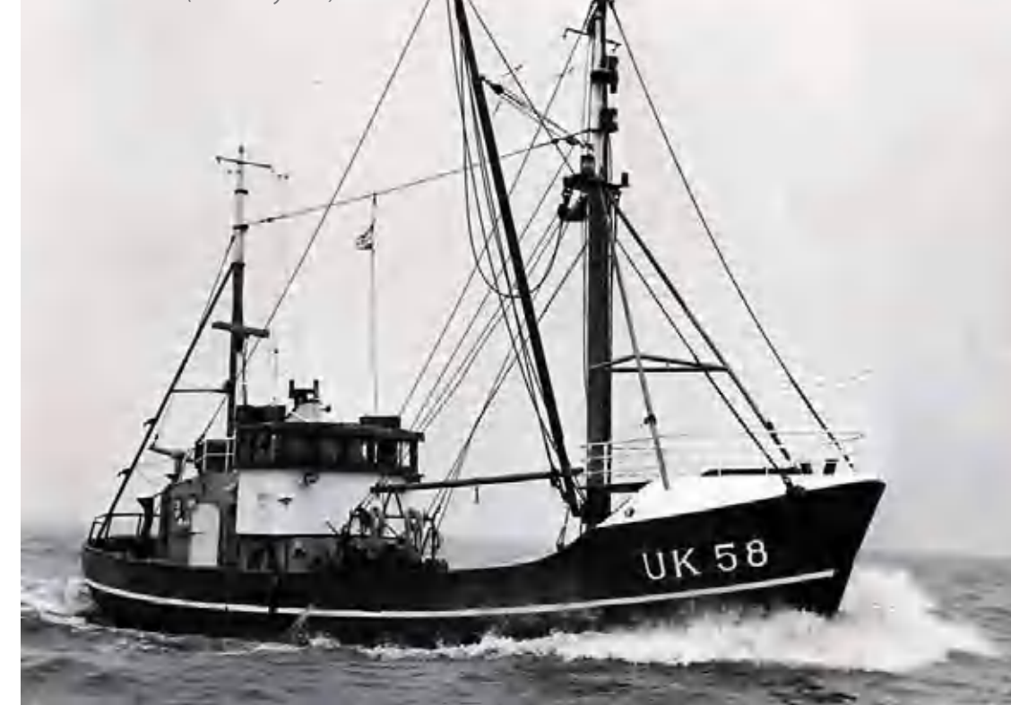
De kotter UK 58

Vader en zoon Willem en Klaas Foppen zijn de laatsten die op het vissersmonument van Harderwijk vermeld staan.