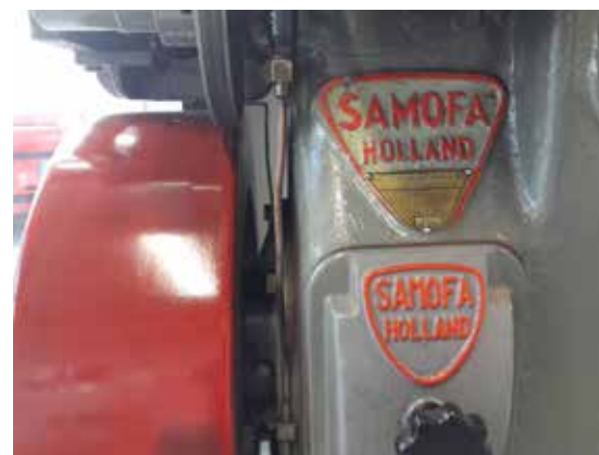
Dit fraai opgepoetste exemplaar staat bij de entree van Machinefabriek Harderwijk.

Oudere Harderwijkers kunnen zich de Samofa-fabriek aan de Boerhaavelaan ongetwijfeld herinneren. Maar wat