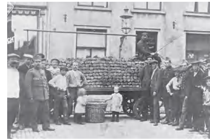
Broodvervoer naar het Belgenkamp door Meerens

In november 1931 verrichtte sleperij Meerens een zware klus. Voor de uitbreiding van de melkfabriek Amerfortia II aan de Stationslaan (tegenwoordig Stationsplein nr.126.) moest een nieuw ketel van 15 ton geplaatst worden. Het gevaarte moest met gebruikmaking van houten rollen van het station naar de fabriek vervoerd worden. Met paarden- en mankracht lukte het karwei in drie dagen.