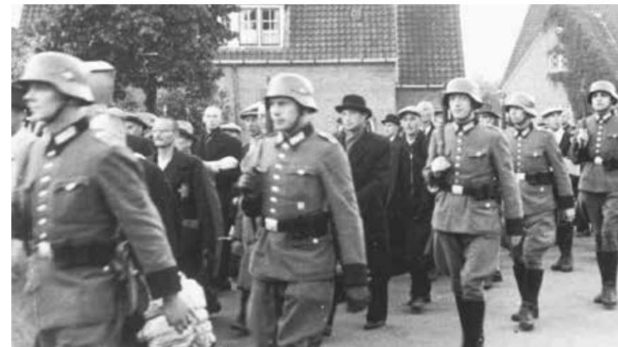
De tocht in Amersfoort van het station naar Kamp Amersfoort