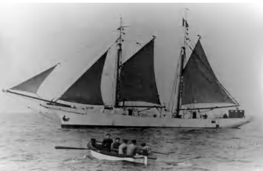
Hospitaalkerkschip "De Hoop II"