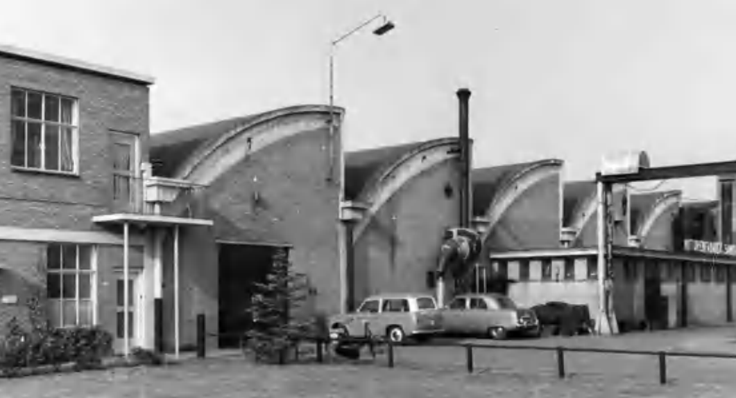
Het front van de fabriek.

te halen. En met succes. In korte tijd vestigden veel bedrijven zich op de industrieterreinen. 2