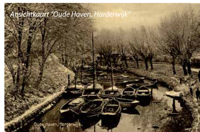
Ansichtkaart "Oude Haven, Harderwijk"

tot eind november. De eerste scholen haring werden gevangen bij de Shetland-eilanden; geleidelijk verplaatste de haring zich naar het zuiden en de vloot volgde op de voet. Op een teelt van dertig weken kwam men gebruikelijk vijf keer terug in de thuishaven alwaar gelost en gebunkerd werd. De bemanning kreeg dan een paar dagen vrijaf om huiswaarts te keren. Tussen december en april waren de Harderwijker loggervarenders weer in Harderwijk. Zij probeerden dan nog wat bij te verdienen. Knecht worden op één der Zuiderzeevervisserijsschepen zat er niet in, schippers en knechten maakten veelal afspraken voor een visserijseizoen. Veel Harderwijker loggervarenders hadden een klein scheepje, een kubbeboot, punter of pluut,