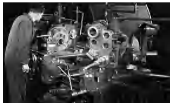
Zo werd een Samofa-motor in de jaren vijftig opgebouwd.

Met een startkapitaal van 600.000 gulden, een flink kapitaal voor die tijd, werd aan de Boerhaavelaan 2 een fabriek neergezet door de Samenwerkende Motoren Fabriekanten (kortweg: Samofa). De productie startte in 1950 en zou duren tot 1988. In die periode zijn duizenden motoren in elkaar gezet en gedistribueerd. 3 De afzet was vooral in eigen land, maar ook in Indonesië en Afrika zijn relatief veel motoren terechtgekomen.