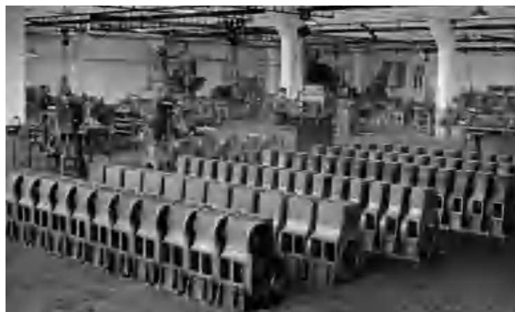
Tientallen gietijzeren omhulsels staan klaar om verder verwerkt te worden.

in kleine slepers gebouwd, in vissersschepen, in kleine binnenvaartschepen. Maar er zijn ook Samofa's in een stationaire uitvoering geproduceerd. Die werden gebruikt in aggregaten en waterpompen.