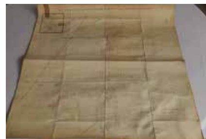
Een tekening uit 1919 van het Belgisch Interneringskamp