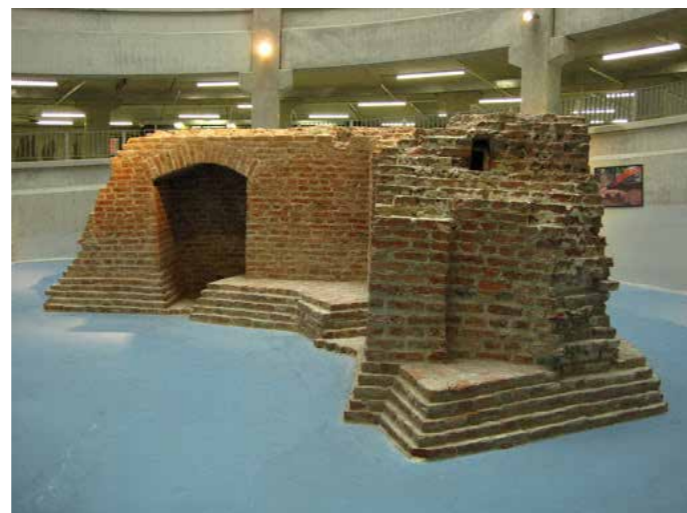
Bij de aanleg van de Houtwalgarage stuitten de bouwers op de restanten van de voorpoort. Die staan nu helemaal onderin de parkeergarage.