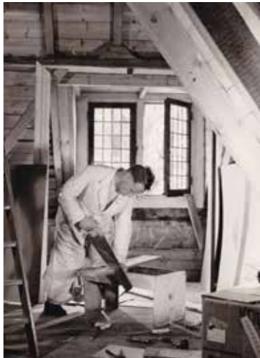
Hard aan het werk om het kasteeltje bewoonbaar te maken, zomer 1950.

Ondertussen hebben de Hierdenaren de paters in hun witte habijten door het dorp zien lopen. De lezer moet zich voorstellen: in het reformatorische dorp waar bijna iedereen in het zwart was gekleed doken opeens katholieke paters op, gekleed in witte habijten en met op hun hoofd een witte bonnet. Het is te leuk om niet te vermelden: de boeren klaagden dat hun koeien minder melk gaven omdat er 'witte spoken' door het dorp liepen.