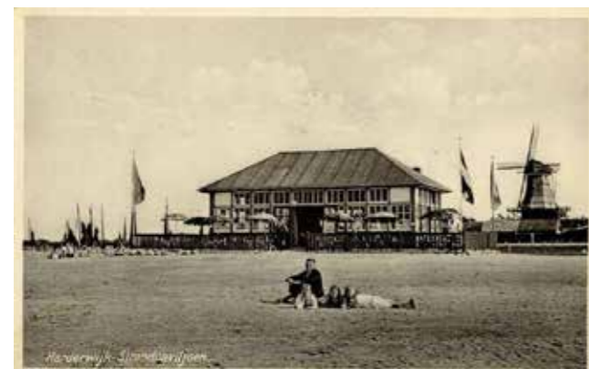
ca. 1935 Het strandpaviljoen van Wakkee. Het fraaie gebouw was voorzien van een groot aantal ramen.

Eind juli 1933 wordt begonnen met het opspuiten van zand uit de vaargeul. Het contract met Van de Pitte wordt op-