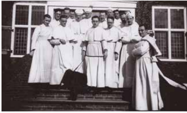
De pioniers die in 1950 naar Hierden kwamen.

Ondertussen hebben de Hierdenaren de paters in hun witte habijten door het dorp zien lopen. De lezer moet zich voorstellen: in het reformatorische dorp waar bijna iedereen in het zwart was gekleed doken opeens katholieke paters op, gekleed in witte habijten en met op hun hoofd een witte bonnet. Het is te leuk om niet te vermelden: de boeren klaagden dat hun koeien minder melk gaven omdat er 'witte spoken' door het dorp liepen.