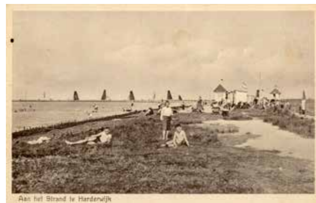
Ca. 1824 Volksbadhuis met linnen afscheiding

In mei 1924 geven B en W de vereniging Zuiderzeebad langs informele kanalen in overweging een aanvraag in te dienen voor de exploitatie van een zogenoemd Volksbad. Voor dat Volksbad staat een bedrag van f 500 ter beschikking. Voorwaarde is dat de toegang voor iedereen betaalbaar of zelfs kosteloos is. De vereniging, niet van plan zijn eigen concurrent op te richten, wijst het verzoek af. Wel wordt de mogelijkheid geopperd de toegangsprijzen te verlagen als de gemeente, in ruil daarvoor, afziet van een gemeentelijk badinrichting. B en W zien wel wat in het voorstel, maar de raad denkt daar anders over en geeft het college opdracht een gemeentelijk badinrichting te openen. De raad stelt f 500 ter beschikking voor het toezicht en de inrichting.