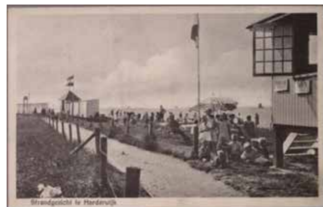
Ca. 1929 op de voorgrond het Volksbad; in de achtergrond het (Zuider) zeebad.

Ondanks het bijna Spartaanse karakter is het Volksbad populair. Dat komt natuurlijk ook omdat het bad gratis toegankelijk is. In 1926 trekt het in 93 dagen 25.269 bezoekers; een gemiddeld aantal van 271 per dag. Het grote aantal bezoekers is mede te danken aan het weer; het bad sluit pas op 25 september.