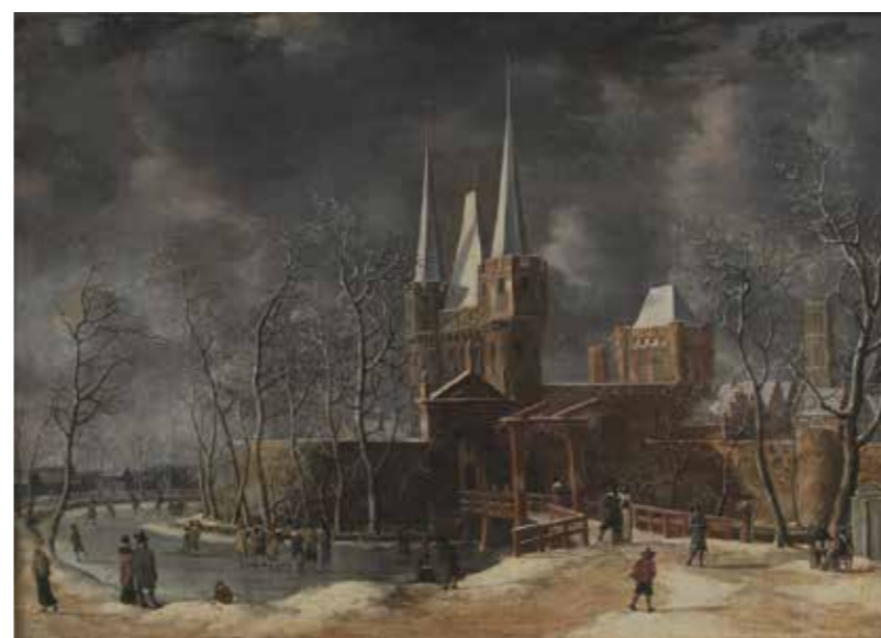
De Luttekepoort op het schilderij van Anthonie van Beerstraaten

Volgens Sloot is Harderwijk een prachtige stad, maar wordt de potentie niet ten volle benut. Hij vindt ook dat er in het verleden veel mooie historische gebouwen zijn verdwenen en denkt dat de herbouw van de Luttekepoort een soort tegenbeweging in gang kan zetten. Waarom nou juist de Luttekepoort hem zo intrigeert kan hij niet goed uitleggen. Een deel van de verklaring is misschien