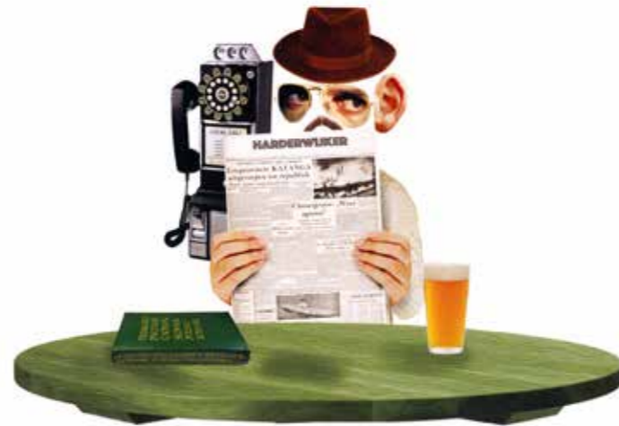
De spion, de vissersvrouw, de scheepsjongen en de schilderes: ze verbeelden de verschillende personen die bezoekers in het museum tegen kunnen komen.

Samen bedachten ze het concept voor Pension Harderwijk.