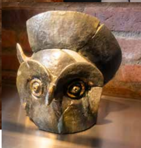
Archeologische kelder Havendam geopend