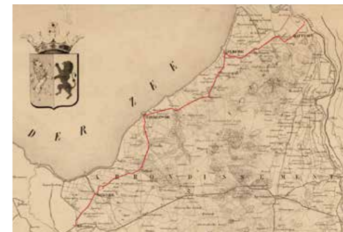
Route Zuiderzeestraatweg 1859 met rood aangegeven

De initiatiefnemers bleven doorzetten en bij de betrokken gemeentebesturen werd het plan uiteengezet. De grootgrondbezitters konden de gemeentebesturen overtuigen en op 17 september 1826 verzochten zij Koning Willem I per brief zijn toestemming te geven aan de aanleg van de Zuiderzeestraatweg. Dit deden zij onder de naam 'Commissarissen voor de Aanleg van de Straatweg langs de Zuiderzee'. Koning Willem I gaf op 9 maart 1827 goedkeuring aan het voorstel tot aanleg van de straatweg. Al in 1830 werd de Zuiderzeestraatweg opengesteld.