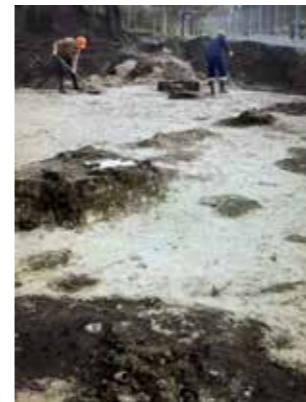
Opgraving van de fundamenten van de Sint Jurriënkapel door RAAP

Het archeologisch onderzoek in Harderwijk kon maar in een beperkt gebied succesvol worden verricht, omdat op het terrein een gebouw met diepe kelders heeft gestaan: