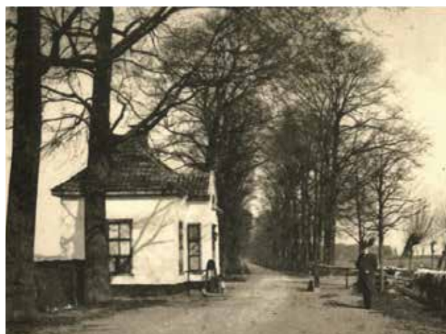
Tol nr. 7 bij Hierdenseweg

verleend voor het hele traject. De Harderwijkse firma P. Elshoff & Co leverde de stenen: honderd per vierkante el. In Harderwijk lagen eind december 1829 25.000 stenen klaar om gebruikt te worden. Om de aanleg van de straatweg terug te verdienen werd er tol geheven. Tussen Amersfoort en het Katerveer stonden 14 tolhuizen, alle met een onderlinge afstand van circa 5 kilometer. De tolhuizen mochten niet binnen 2500 ellen van het midden van een stad of dorp worden gerealiseerd. Op het grondgebied van Harderwijk was er één tol. Deze bevond zich op de kruising Hierdenseweg, Hogeweg en Kampweg, hoewel een andere bron meldt dat er een tolhuisje voor de Luttekepoort heeft gestaan.