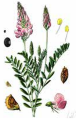
Esparcette ( Onobrychis viciifolia ), plant uit de vlinderbloemfamilie

De patiënten werkten onder andere in de moestuin van het tehuis. Rond het complex domineerden waarschijnlijk akkers en graslanden. Op de akkers werden rogge, boekweit en hennep verbouwd en mogelijk ook erwten. Ook werden pollen van esparcette aangetroffen, een gewas waarvan het blad vermoedelijk bij de bestrijding van lepra werd gebruikt. Esparcette ( Onobrychis viciifolia ) heeft een symbiotische 4 relatie met de Rhizobium-bacterie. Deze bacterie helpt de plant stikstof uit de lucht vast te leggen in de bodem. Esparcette is een roze klaverachtige plant uit de vlinderbloemfamilie en lijkt veel op lupine. Het werd vroeger ook wel als bodembemester uitgezaaid. Het is een uitstekend voedergewas met name voor paarden. Het vermindert de kans op koliek 5 , ondersteunt de spieropbouw omdat het veel eiwitten en aminozuren bevat, ontstekingsremmend is en het weefselherstel ondersteunt. Esparcette wordt 20 tot 70 cm hoog en heeft een voorkeur voor vochtige kalkrijke grond, zoals bij de leprozerie zal zijn aangetroffen.