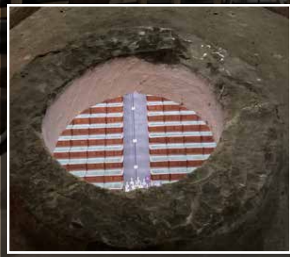
De kruisgewelven met de loopbruggetjes Inzet: van bovenaf is het interieur van de kerk beneden zichtbaar

In de maanden mei en juni organiseerde de Stichting Vrienden van de Grote Kerk een rondleiding over de gewelven van de Grote Kerk. De opbrengst hiervan wordt gebruikt voor de laatste fase van het restaureren van de gewelvschilderingen. Het was een unieke kans om te zien hoe men in de 14 e eeuw al zo mooi kon bouwen. De waarschuwingen vooraf 'betreden op eigen risico' en 'geen last van hoogtevrees' beletten de deelnemers niet van het beklimmen van de vele wenteltrappen. Eenmaal boven konden ze goed zien hoever de restauratie al gevorderd was én hoeveel er nog te doen is. De gids gaf vakkundig uitleg over het geheel. Via aangelegde bruggetjes met balustraden konden de bezoekers boven de gewelven lopen. Als kers op de taart gingen ze twee aan twee nog een trapje hoger naar de ruimte waar de beiaardier zit. Via een nog hoger gelegen raam was het uitzicht over de stad fantastisch! Sommige groepen klommen daarna nog naar de zgn. nonnengang: de balustrade helemaal boven in de kerk, waar de vrouwelijke geestelijken volgens zeggen de dienst bijwoonden. Boven in de gewelven bevinden zich drie gaten, waar door je een uitzicht hebt op de kerk beneden. Het verhaal gaat dat in vroegere tijden, ter illustratie, op Hemelvaartsdag een beeld van Jezus door zo'n gat omhoog gehesen werd.