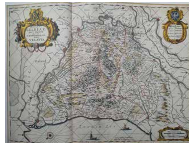
Kaart van de Veluwe, rond 1550, met ingekleurde handelswegen, bron: Natuurmonumenten, 'De Veluwe'

In 1736 zijn door de Admiraliteit van Amsterdam zogenaamde 'Heerebaanen' aangewezen. Het waren vanaf