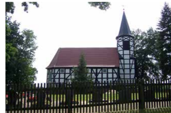
Vakwerkhuis van Hoyerswerda-Spreewitz in Duitsland (Het gebouw zou kunnen lijken op de Sint Jurriënkapel)

die waarschijnlijk een eenbeukig gebouw van 7 bij ruim 14 meter hebben gedragen. Vermoed wordt een gebouw met een vakwerkskelet, met leem opgevuld en bedekt met een zadeldak met houten gebintconstructie: een kapel die omstreeks 1344 werd gebouwd en die kan worden vergeleken met het kerkje van Hoyerswerda-Spreewitz in het Duitse Saksen.