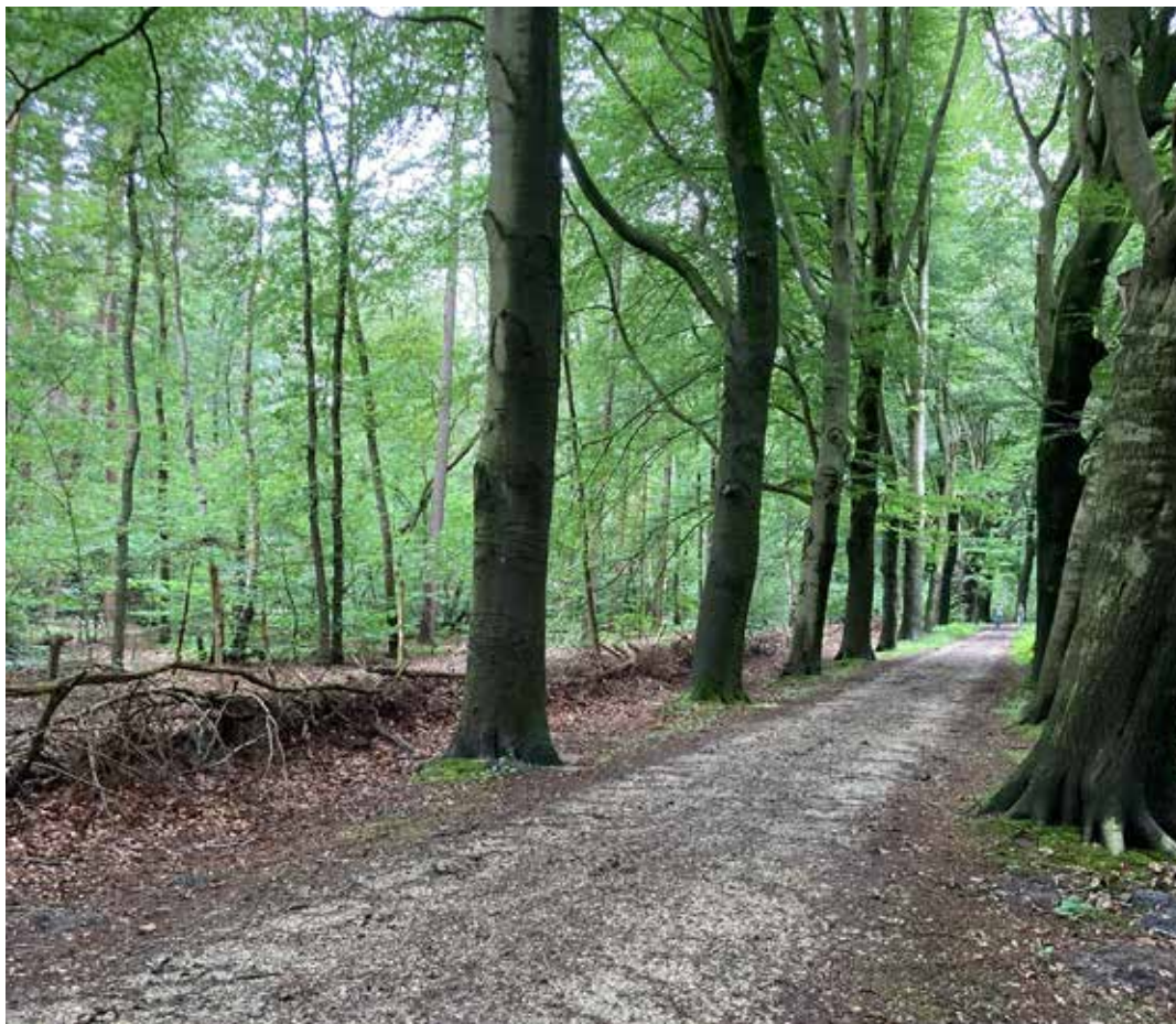
Deel van de oude route van de Harderwijkerweg in Hulshorst