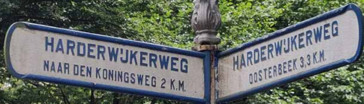
De Harderwijkerweg nabij Oosterbeek