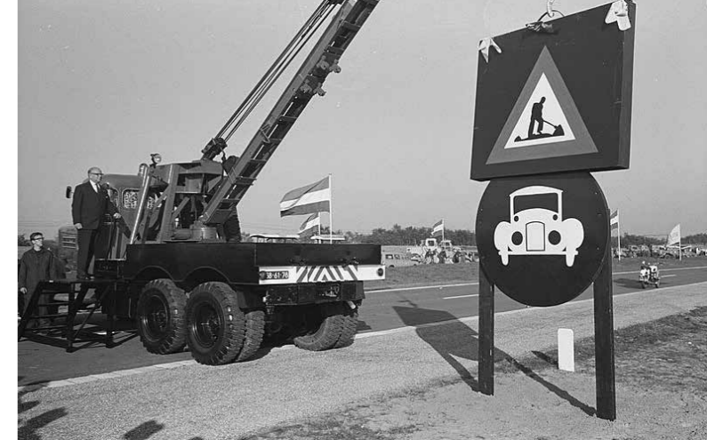
Dhr. Korthals opent een deel van Rijksweg 28 tussen Harderwijk en Wezep in 1962

Rond 1960 is begonnen met de aanleg van een nieuwe autosnelweg (A28) tussen Hoevelaken en Zwolle. Deze snelweg werd niet door de dorpen aangelegd, omdat dit te veel verkeersoverlast zou veroorzaken. Uiteindelijk