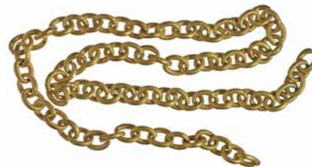
Deze gouden schakelketting werd gevonden in een beerput van de stadhouderswoning binnen de dwangburcht

De resultaten overtroffen alle verwachtingen. Er werden resten van de dwangburcht gevonden, een gaaf stuk stadsmuur kwam bloot te liggen en de fundamenten van een stadspoort werden aangetroffen. Plus dat veel gebruiksvoorwerpen werden gevonden. Die voorwerpen werden vooral aangetroffen in een aantal putten. Na de opgraving werd het nieuwe restaurant Lef & Co gebouwd,