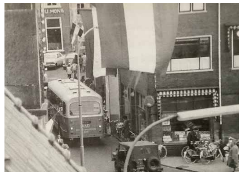
Bus rijdt door de Wolleweverstraat

meestal herbergen of logementen. De postwagen reed twee keer in de week heen en terug. Het tarief varieerde van 'drie gulden vyf stuyvers' tot 'twee gulden vyfthien stuyvers'. Vanaf 1849 verschenen de diligences van Van Gend & Loos op het traject. Veel mensen hadden geen geld voor dit openbaar vervoer en gingen lopend over de straatweg. Met de aanleg van de spoorlijn Amersfoort – Hattem, in gebruik genomen in augustus 1863, en de komst van de auto, verdween de postwagen. De Veluwe Autodienst (VAD) begon in 1923 met vervoer over de Veluwe. De hoofdroute langs de IJsselmeerkust liep en loopt nog steeds via de Zuiderzeestraat.