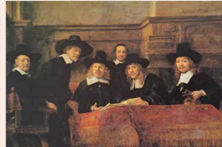
Schilderij van Rembrandt 'De staalmeesters', bijnaam van het kabinet

vergeleek men Theo de Meester met een goede loods die de pech had dat hij zijn werk moest doen op een wrakke schuit.