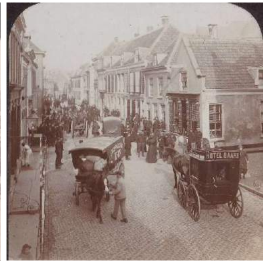
Smeepoortstraat vanaf nummer 19 (idem)