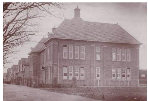
onbewerkte foto collectie Petersen