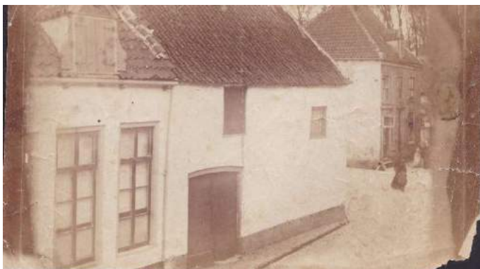
Smeepoortenbrink 8, genomen vanuit de 1 e verdieping van Dalhuisens woonhuis op 7.

schoons vernielen") 48 , en vanaf zijn pensionering, bestuurslid van de Bond van Gepensioneerden "ter bevordering hunner belangen en met uitsluiting van partijpolitiek" 49 . Ook zit hij in het comité voor het Rembrandt-jaar 1906 dat als doel had "ter eere van Rembrandt's nagedachtenis, de woningen der minder bedeelde medeburgers te verlevendigen en te versieren met zijne kunst" 50 , in het Pestalozzi-herdenkingscomité 51 , en in het comité tot oprichting van een "oudheidkamer" 52 .