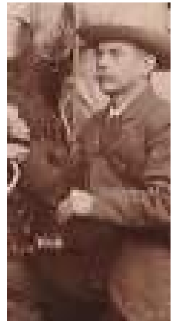
uitsnede stereofoto Eifel, rond 1910. Collectie Petersen

Dalhuisen maakte voornamelijk foto's van vissers, marktlui, en stadstafereeltjes, van straten, gebouwen en de haven van Harderwijk. Vanuit alle drie de huizen waar hij woonde, heeft hij uit het raam opnames gemaakt. Hij fotografeert in de omgeving van Harderwijk de bossen, hei en buitenwegen, soms met mensen erop. Hij fotografeert in 1908 het berijpte Slingerbos en het kruierend ijs op de Zuiderzee maar ook specifieke gelegenheden zoals in de Hortus bij het 25-jarig