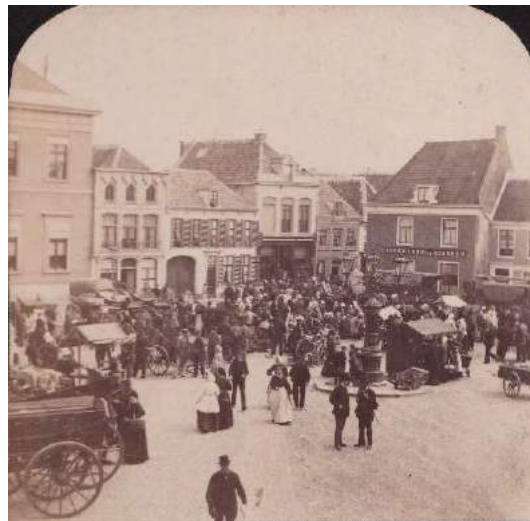
vanaf 7. Collectie Petersen Panorama Markt vanaf Donkersraat 61 (idem)