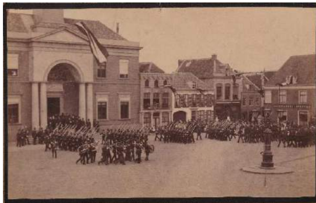
Defilé op de Markt.