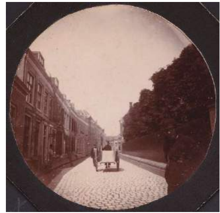
Donkerstraat met man met handkar, rond 1893.