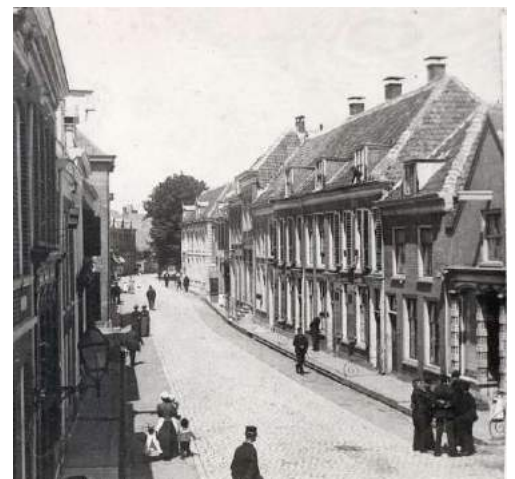
Smeepoortstraat, afdruk glasnegatief.

Nader onderzoek in het Stadsmuseum wijst uit dat zich daar nog enige honderden stereofoto's in het archief bevinden die op grond van overeenkomst in afbeelding en/of handschrift van aantekening op de achterzijde toegeschreven kunnen worden aan Dalhuisen. Verder een serie van 75 glaspositieven of lantaarnplaatjes met opnamen die toegeschreven kunnen worden aan Dalhuisen, en ook een serie van twintig stereo glasnegatieven die in 1986 geschonken zijn door L. van Polen 104 , met oude topografische opnames van Harderwijk die in opdracht van de fa. Wuestman in Harderwijk gemaakt zijn. In ieder geval