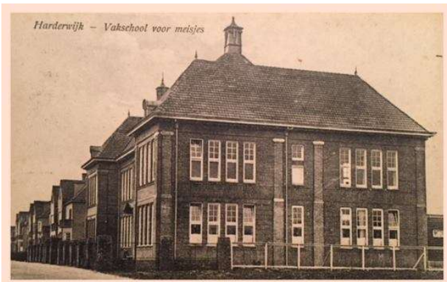
prentbriefkaart uitgave Wuestman