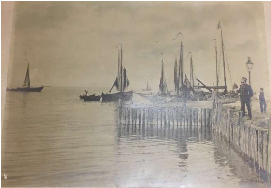
Haven Harderwijk, grootformaat foto Stadsmuseum

14 juli 1894 werd een internationale fotografie-tentoonstelling in Arnhem gehouden, met in totaal 197 inzendingen 92 . Mogelijk was Dalhuisen met zijn 'gezicht op de haven van Harderwijk' 93 een van de inzenders, maar hij viel niet in de prijzen.