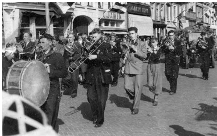
De muzikanten tijdens bevrijdingsfeest 1945

Behalve Kunst Na Arbeid zijn nog meer verenigingen vanuit de buurtvereniging voortgekomen zoals de gymnastiekvereniging HSC en het kinderkoor. Dit laatste koor is opgegaan in andere koren.