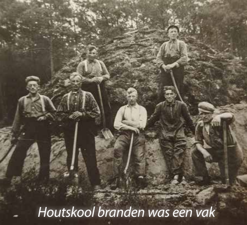
Houtskool branden was een vak