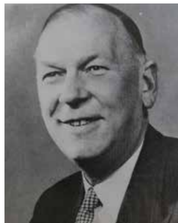
bron: 'Geschiedenis van Harderwijk', red. J. Folkerts, 1998, Boom Amsterdam