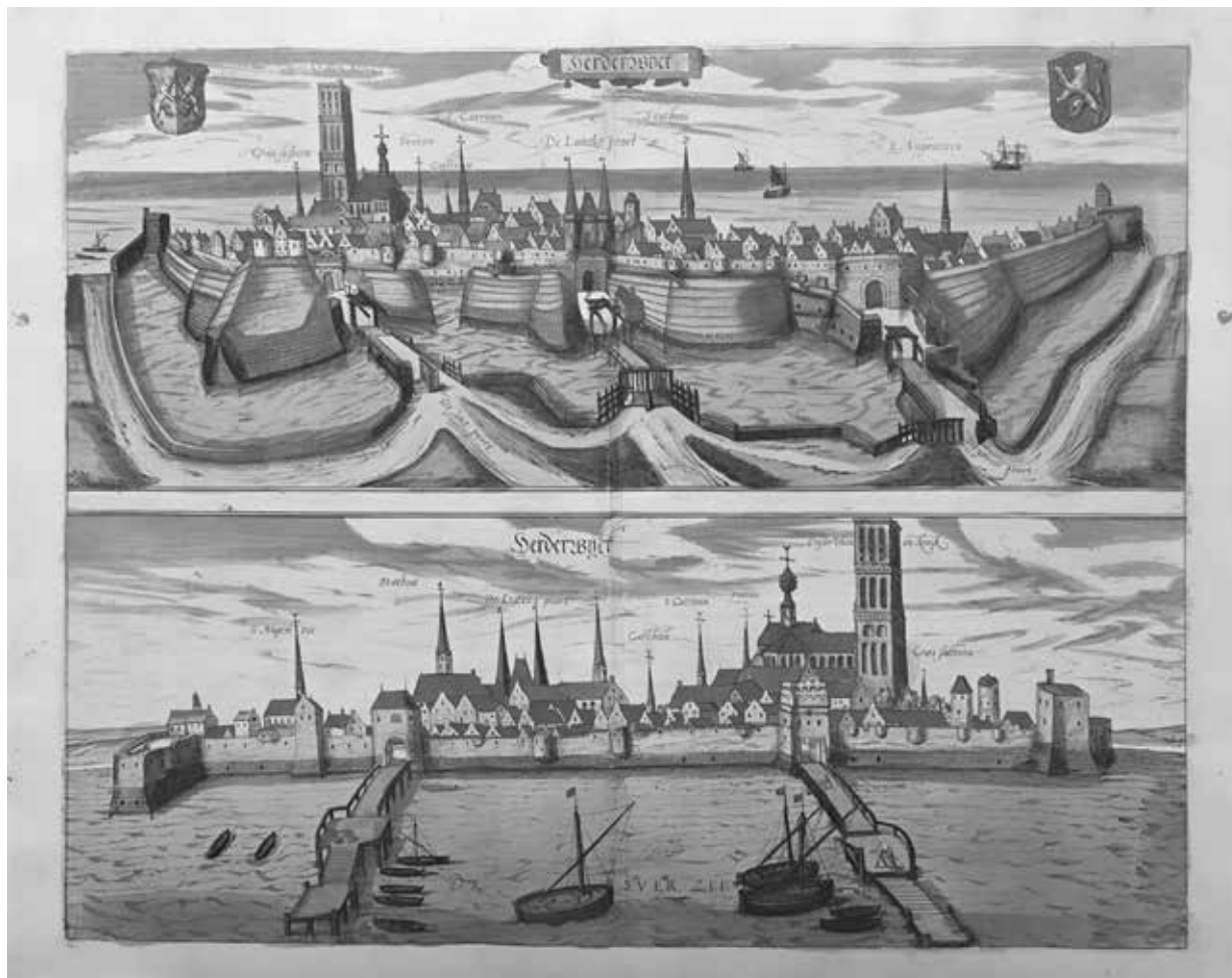
Twee stadsprofielen van Harderwijk, getekend door Georg Braun en Frans Hogenberg, 1595