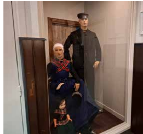
De twee poppen in plaatselijke klederdracht

bij deze jubilea benoemd tot Erelid of Lid van Verdienste.