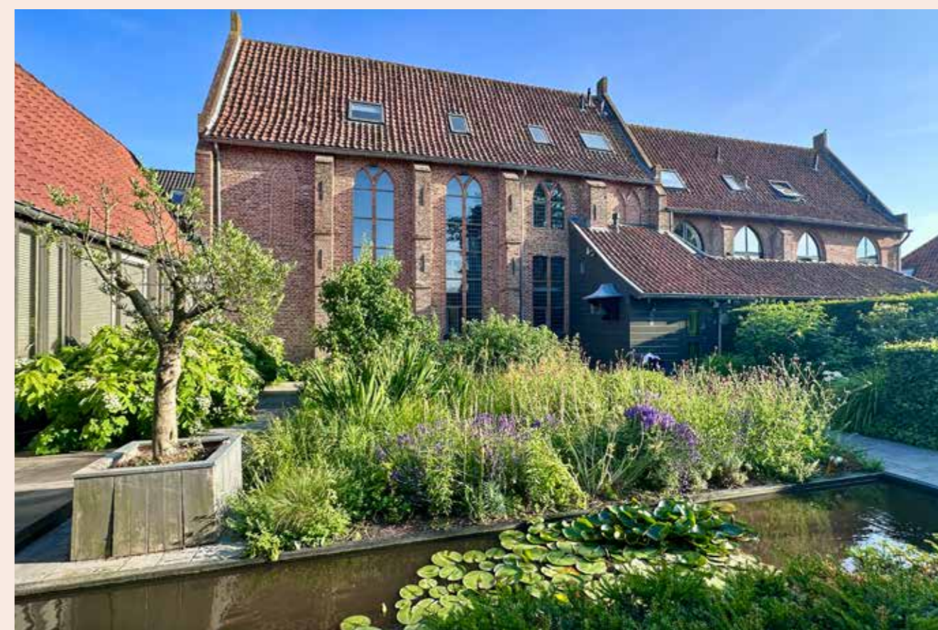
Achterkant van het Pesthuis (Straat van Sevenhuizen)