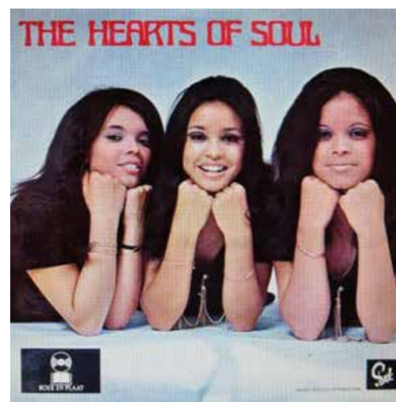
Hearts of Soul (1970)