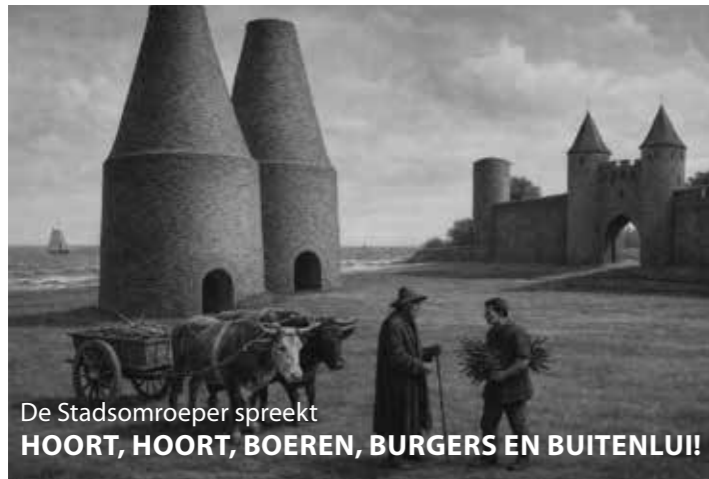
De Stadsomroeper spreekt HOORT, HOORT, BOEREN, BURGERS EN BUITENLUI!