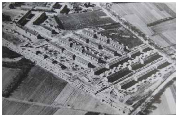
Bouw van de wijk Tweelingstad, bron: 'Geschiedenis van Harderwijk'

Door de steeds betere economische verwachtingen bleken de berekeningen voor het aantal huizen in de nieuwe wijk Tweelingsstad veel te