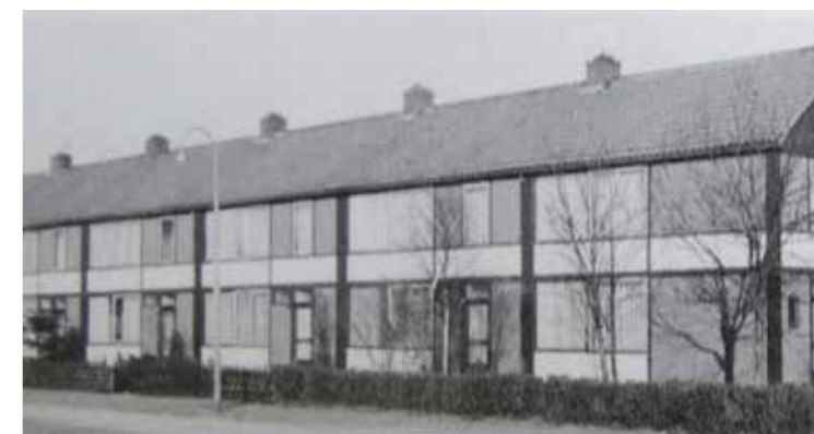
Oostenrijkse woningen in Harderwijk

Inmiddels wonen er zo'n 6.500 inwoners in de wijk Tweelingstad, waarvan Tinnegieter de kleinste (20 hectare) maar meest dichtbevolkte buurt is. Hoewel Tweelingstad zeker geen duplicaat van de binnenstad is geworden, is het wel een wijk met veel voorzieningen. Op het industriegebied Sypel zijn inmiddels vooral lichte industrieën en