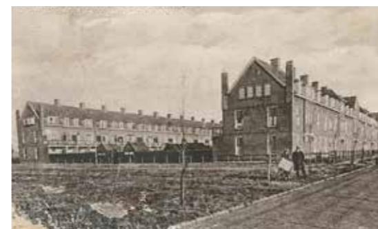
Prins Frederik Hendriklaan, ansichtkaart