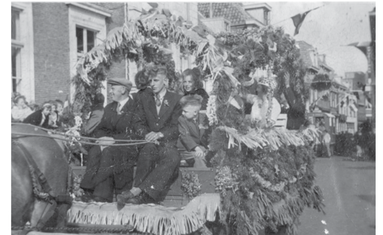
Hierdense wagens bevrijdingsfeest 1945