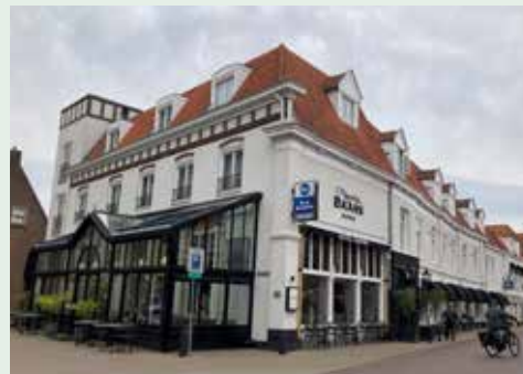
Hotel Baars bestaat 150 jaar

Hotel Baars bestaat 150 jaar. In 1875 nam Gerardus Baars hotel Decroix over. Na een verbouwing volgde in 1876 de opening. Het hotel is altijd in handen van de familie Baars gebleven.