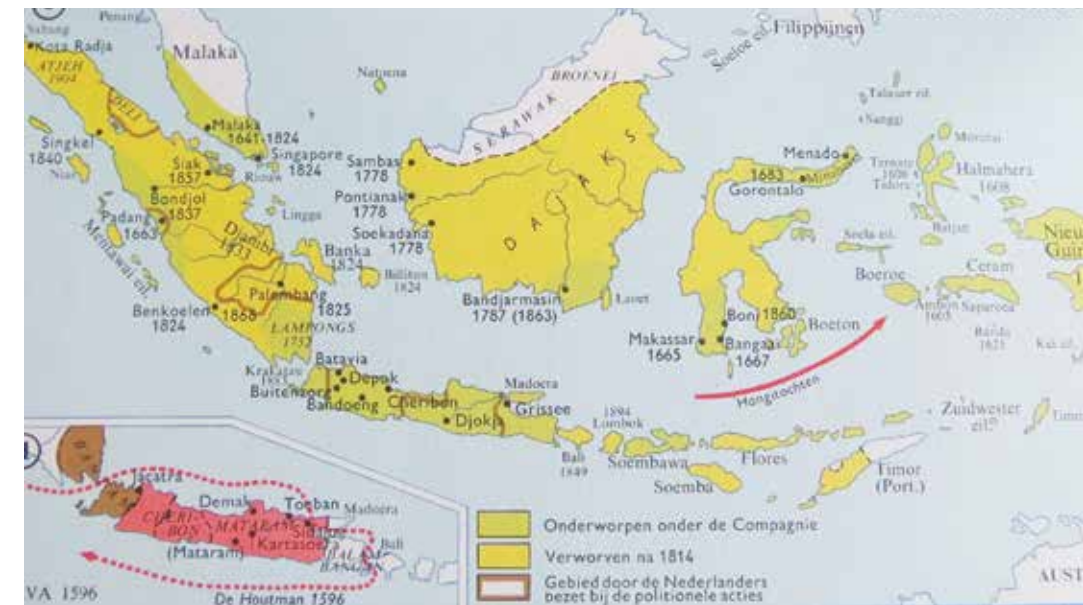
Kaart Nederlands-Indië, Meulenhof Historische Atlas

Een kleine gemeenschap als een kampong of dessa had meestal een dorps- hoofd die de bevolking vertegenwoordigde, terwijl het hogere bestuur werd gevormd door de Indische adel, waarbij een duidelijk verschil bestond tussen lagere en hogere adel. De bevolking was veelal verplicht tot het verlenen van 'herendiensten', het belangeloos verrichten van werkzaamheden voor de vorst, de Radja of Sultan. Ook diens hofhouding moest meestal geheel worden vrijgehouden, wat voor de bevolking een zware last kon zijn. Handel was meestal in handen van Chinezen die naar Indië geëmigreerd waren of van Arabieren die vooral aan de kust handel dreven. De pasar (markt) was de plaats waar gehandeld werd net als de toko (winkel) waar artikelen werden gekocht of verkocht. Natuurlijk hadden de inlanders hun gewoonten en ondeugden zoals de hanengevechten en het gokken. Een goede haan was een vermogen waard en bij weddenschappen werden enorme bedragen ingezet. Bewoners van de kuststreken waren niet zelden smokkelaars of plunderden gestrande schepen.