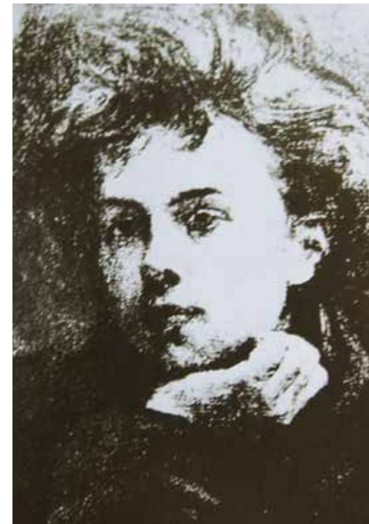
Arthur Rimbaud

"Mijn Bohème Ik ging op weg. mijn vuisten in versleten zakken; Mijn overjas was ook alleen nog een idee; O Muze, Ik liep onder de hemel met je mee; en maar als je vazal naar grote liefdes snakken!"