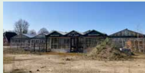
Voormalige bloemenkwekerij Flora Jozina

Op het terrein van voormalig bloemenkwekerij Flora Jozina komt geen sociale woningbouw. De ontwikkelaar koopt