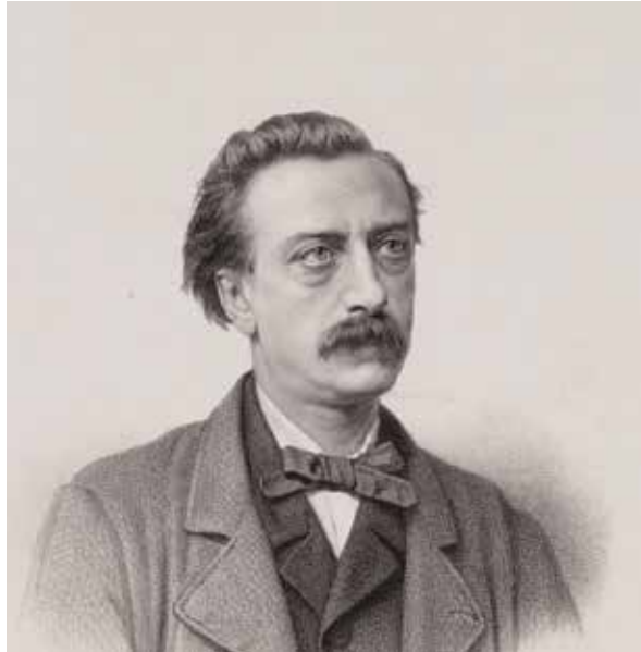
Eduard Douwes Dekker

de bevolking het slachtoffer van werd. Hij schreef onder het pseudoniem Multatuli, wat zoveel als 'ik heb veel geleden' betekent. Het boek sloeg in Nederland in als een bom en had ook grote gevolgen in de beeldvorming en in de politiek. Langzamerhand werd het cultuurstelsel, vanaf 1870, afgeschaft en drong het besef door dat de opbrengsten van Indië ook het eigen land ten goede zouden moeten komen. 18