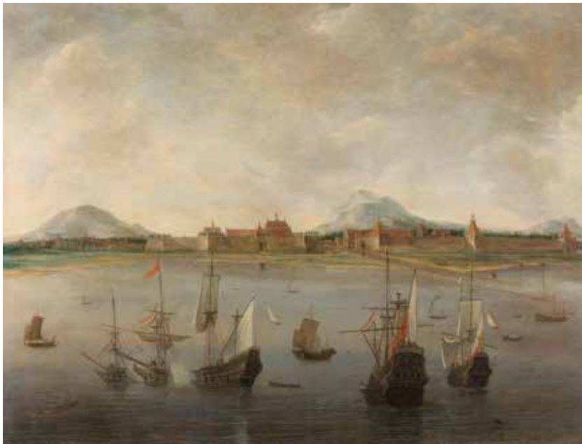
Blik op Batavia

Als na een lange reis Batavia in zicht kwam, zal dat over het algemeen grote opluchting hebben gegeven. De zeereis, met alle gevaren van dien, was achter de rug. Tandjong Priok was de haven van Batavia waar grote activiteit heerste. De stad was rond 1600 gesticht door Jan Pieterszoon Coen en in 1815 al uitgegroeid tot een grote metropool waar Chinezen, Europeanen en de Indische bevolking samenleefden. Batavia was aangelegd volgens Hollands model met grachten, bruggen en binnenstromende rivieren. Doordat deze, door de grote hoeveelheid fecaliën en afval dichtslibden, ontstonden