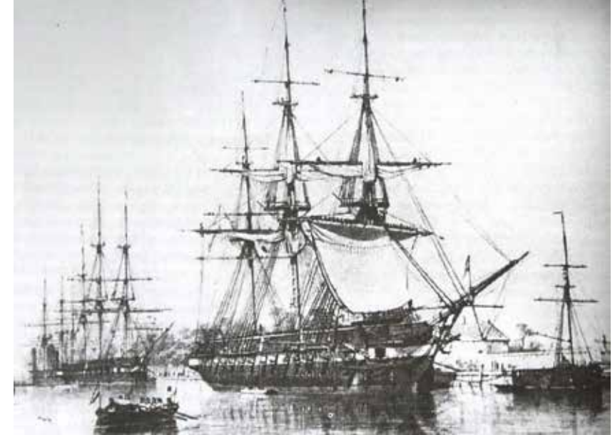
Fregat De Ruyter

Een anonieme soldaat stelde in 1817 zijn bevindingen op schrift en beschreef zijn zeereis naar Batavia. 15 Eerst geeft hij een uiteenzetting over de motieven waarom mensen zich aanmelden: een misdad, een bankroet, of problemen in de familie. Op zee verblijft de schrijver het liefst in de mast, waar hij zich een rustig plekje kan verwerven en neerkijkt op het rumoer op het dek. Vloekende matrozen, schreeuwende officieren, hij ziet het vanuit de hoogte aan en werpt ondertussen zijn blik op de zee rondom hem heen. Het heeft een rustgevende uitwerking op zijn gemoed en als de zee eveneens rustig is, geniet hij van zijn uitzicht. Het is echter lang niet altijd rustig. Als de