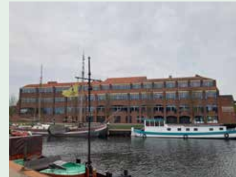
Het Huis van de Stad, voorbeeld van een Post 65-pand

Het Gelders Genootschap voert in opdracht van de gemeente een inventarisatie uit van waardevolle objecten en complexen uit de periode 1965-1990. Deze zogenaamde Post 65-periode is van groot belang voor het huidige aanzicht van Harderwijk. De inventarisatie van panden en objecten ligt nu bij de gemeente ter beoordeling of ze in aanmerking komen voor de status van gemeentelijk monument of beeldbepalend object.