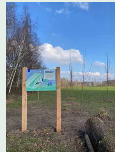
Het geboortebos aan de Bijlaardsweg

Vandaag hebben ouders voor bijna honderd baby's een geboortebos geplant.