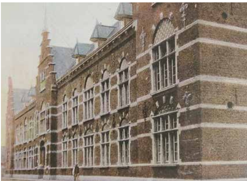
Militair hospitaal

Bij de vestiging van het Werfdepot was bedongen dat er een verpleeginrichting in de stad zou komen en deze infirmierie werd gehuisvest in een gedeelte van een oud Agnietenklooster, gelegen bij de huidige Kaatsbaan. Dit was echter een bouwval met weinig mogelijkheden tot isolatie in geval van uitbreken van een besmettelijke ziekte. Omdat de oude infirmierie niet voldeed maakte men plannen voor de bouw van een nieuw ziekenhuis, het militaire hospitaal dat op de plek kwam van het voormalige klooster. In 1883 werd hiervoor de eerste steen gelegd. Het nieuwe hospitaal, 11 met polikliniek, apotheek, quarantaineafdeling en maar liefst 114 bedden was een hele verbetering. Het was niet alleen bestemd voor soldaten van het Werfdepot, maar ook voor militairen die terugkeerden uit de Oost. Ook burgers mochten er in noodsituaties gebruik van maken. Patiënten met allerlei ver-