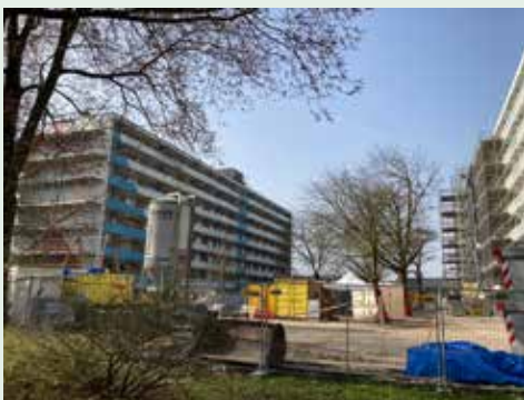
Renovatie van flats aan de Goeman Borgesiuslaan

De gemeente trekt vierhonderdduizend euro uit voor de herinrichting van de openbare ruimte Goeman Borgesiuslaan. Hiermee worden de leefbaarheid en de sociale veiligheid vergroot door het verminderen van de parkeeroverlast en van de afvalproblematiek, het stimuleren van