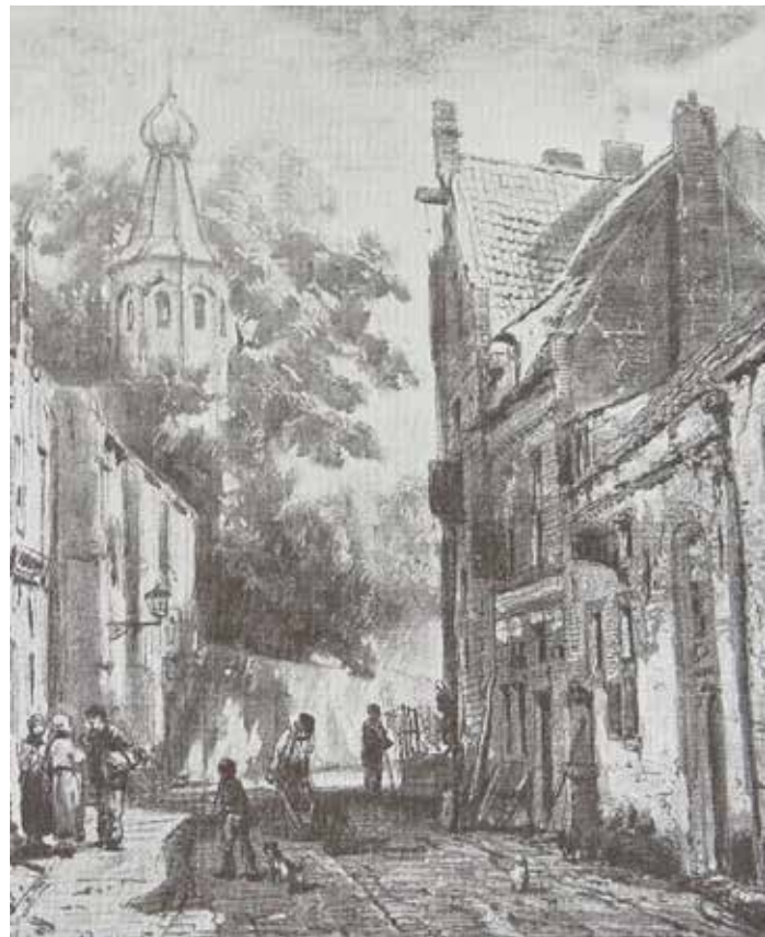
Academiestraat, geschilderd door Cornelis Springer, Harderwijk in oude prenten, 1974

Ook in Harderwijk, aan de kust van de Zuiderzee, was de situatie verre van rooskleurig en was armoe troef. Na de Hanzetijd luidden de stadsbrand van 1503 en de pestepidemie van 1506 mindere tijden in. Ook de verzanding van de kust voor Harderwijk deed geen goed aan de welvaart van de stad. Gelukkig had Harderwijk nog zijn universiteit die in 1648 was opgericht. De Gelderse Universiteit was dan weliswaar klein, maar het betekende in elk geval dat studenten en hoogleraren de weg naar de stad wisten te vinden. Ook de Gelderse Munt, waar gewestelijke munten werden geslagen, gaf de stad nog enig cachet. De koning van Holland, Lodewijk Napoleon, had echter met één pennenstreek in 1806 het voortbestaan van deze instelling doorkruist. De universiteit