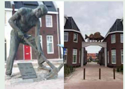
links: het beeld 'De Asbestdelver' is teruggeplaatst. rechts: 'De Visch op de Poort'

In Ons Stadsgezicht in Waterfront Harderwijk zijn twee kunstwerken geplaatst. Een belangrijk moment was de terugplaatsing van het beeld 'De Asbestdelver'. Dit kunstwerk was in 1975 geplaatst ter ere van het veertigjarig bestaan van de asbestfabriek Asbestona. Het tweede kunstwerk is 'De Visch op de Poort', dat symbolisch de historische binnenstad met de nieuwe wijk verbindt.