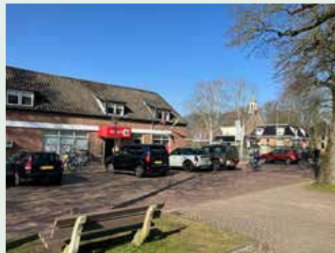
'Hart van Hierden'.

De gemeente Harderwijk ondertekent de intentieovereenkomst 'Hart van Hierden'. Gestreefd wordt naar een multifunctionele ontwikkeling van het dorps hart. Naast de gemeente zijn ook de buurtvereniging Hierden, de Hervormde kerk, zorggroep Noordwest-Veluwe, Careander, de stichting VCO (basisschool De Parel), de Spar Hierden, D. van den Brink, ZorgDat, Omnia Wonen en Medicamus betrokken.