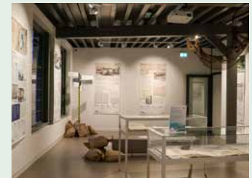
De vergeten watersnoodramp te zien in het Stadsmuseum.

In het Stadsmuseum is een maand lang een expositie te zien over de vergeten watersnoodramp in 1825. In de nacht van 3 op 4 februari wordt Nederland geteisterd door een noordwesterstorm. Op de Noord-Veluwe kost de storm 29 levens. Straten lopen onder en het water staat in Harderwijk wel tot een meter hoog.