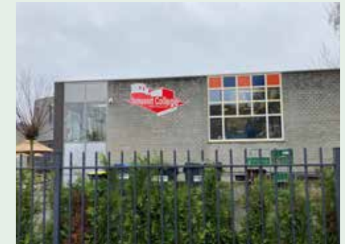
'Mijn School' heet nu 'Stadspoord College'

'Mijn School' heet vanaf nu het 'Stadspoord College'. Een nieuwe naam, passend bij alle nieuwe kennis en vaardigheden die de leerlingen leren op school. Tegelijkertijd is de nieuwe winkel geopend.