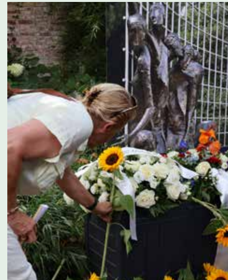
De eerste 15 augustus-herdenking van einde Tweede Wereldoorlog in Nederlands-Indië.

Het college van B&W gaat de 'waardevolle bomenlijst' opnieuw vaststellen. Hierop komen alle bomen te staan met een status als herdenkingsboom of monumentale boom, die 'extra' beschermd zijn.