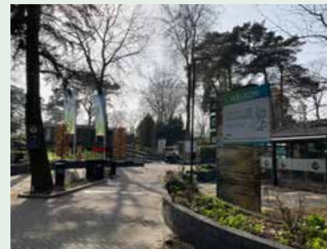
Camping De Konijnenberg krijgt een dwangsom

De Raad van State moet een dwangsom van maximaal € 60.000,= voor camping De Konijnenberg schorsen. Dat eist de advocaat van de camping. De dwangsom is opgelegd vanwege verboden permanente bewoning. Later in het jaar wordt bekend dat de dwangsom gehandhaafd blijft.