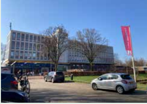
Het Morgen College gekozen als nieuwe locatie AZC