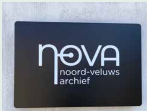
Nova, de nieuwe, gezamenlijke archiefdienst

Acht gemeenten op de Veluwe hebben per 1 juli een nieuwe, gezamenlijke archiefdienst: het Noord-Veluws Archief (NoVA). De gemeenten Elburg, Ermelo, Harderwijk, Nunspeet en Oldebroek en de gemeenten Epe, Hattem en Heerde gaan hun krachten bundelen.