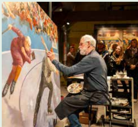
Start van de Hanze Avondturen met de Museumnacht.

Harderwijk start met de allereerste editie van de Hanze Avondturen. De aftrap begint met de Museumnacht, waarbij diverse musea gratis hun deuren openen. Onder andere Stad als Podium, Filmhuis Harderwijk, Anouk Dance Experience en U-Create doen mee.