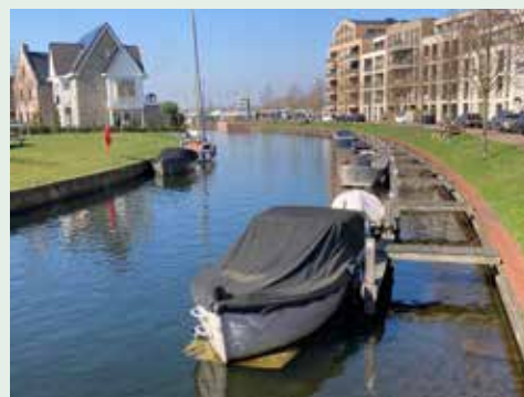
Toch nog aanlegsteigers voor bewoners Waterfront

Door tussenkomst van de Nationale Ombudsman krijgen zes inwoners van het Waterfront toch nog een ligplaats voor