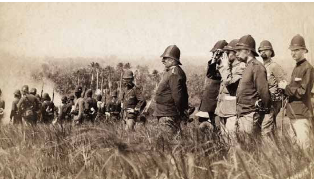
Gerenaal Van Heutz

De latere Nederlandse minister-president Hendrikus Colijn deed mee aan de slachtpartij op Lombok en schreef aan zijn vrouw dat hij negen vrouwen en drie kinderen had doodgeschoten. "Het was onaangenaam werk, maar het kon niet anders", schreef hij in een brief aan zijn vrouw. Hij ontving er de Militaire Willemsorde 4 de klasse voor.