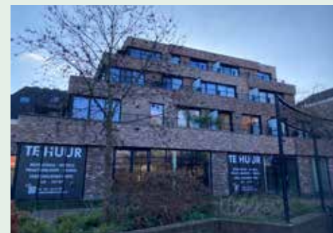
Het appartementencomplex 'De Oude Bieb'

De rechter eist dat de pandeigenaar van 'De Oude Bieb' direct helderheid verschaft