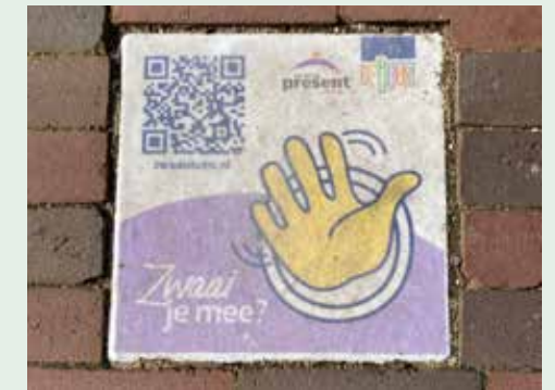
Stichting Present schenkt 18 zwaai-stenen

Verspreid over de stad zijn 18 Zwaai-stenen aangebracht; een geschenk van Stichting Present Harderwijk. De stoeptegels moeten voorbijgangers aanmoedigen om elkaar op straat te groeten of om iemand die vaak thuis zit te gaan bezoeken.