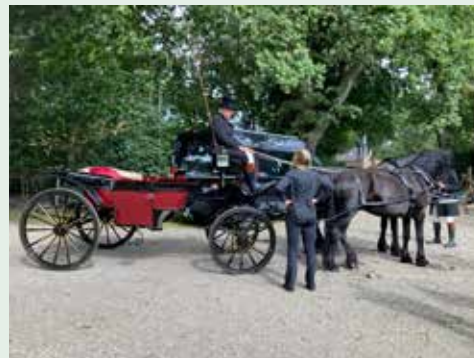
Open Monumentendagen in Hierden

Tijdens de Open Monumentendagen openen meer dan twintig historische locaties hun deuren. Van het oude Kanton-gerecht tot het Pesthuis, tot de raadszaal in het Oude Stadhuis met zijn zeldzame goudleerbehang. Het thema is dit jaar 'Gebouwd om te blijven'. Het Plantagepark is het decor van het Blij Bietjes Food Festival.