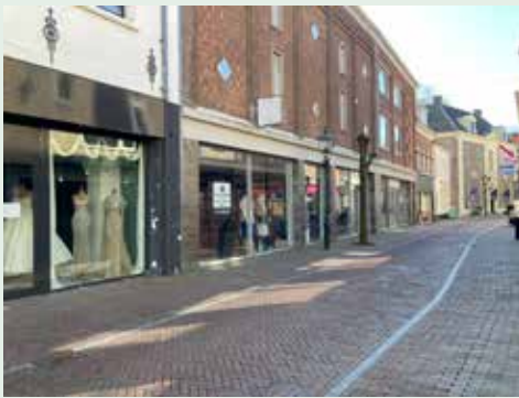
De gemeente koopt het 'Blokperand'