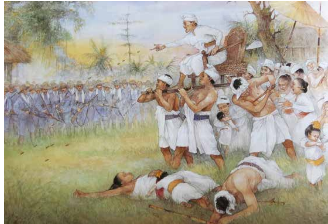
Puputan op Bali

De vrouwen vormden hun eigen hiërarchische gemeenschap en als het nodig was vochten ze met hun mannen mee om de nederzetting te verdedigen. Bij veroveringen werden zij ook slachtoffer van de vijandelijkheden. Deze njais en hun kinderen hadden geen rechten en konden zich nergens op beroepen. Sneuvelde hun partner of vader dan hadden ze domweg pech. Dat was ook het geval als de militair terugkeerde naar Nederland of met verlof ging naar Europa. Weinigen bekommerden zich om de kinderen, die meestal het voetspoor van hun ouders volgden: jongens in het leger, meisjes als concubine van een soldaat. 'Anak kompanie' werden ze genoemd. 'Kinderen van de Compagnie'. Nog meer dan voor hun mannen was het leven een strijd, waarin ze nooit mochten veronachtzamen of opgeven, waakzaamheid was altijd geboden.