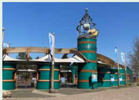
Dolfinarium moet de Michelinster weer inleveren

Dolfinarium Harderwijk moet de onlangs toegekende Michelinster weer inleveren. Michelin heeft besloten om alle dolfinaria en waterparkshows met dieren in gevangenschap uit hun aanbevelingen te schrappen.