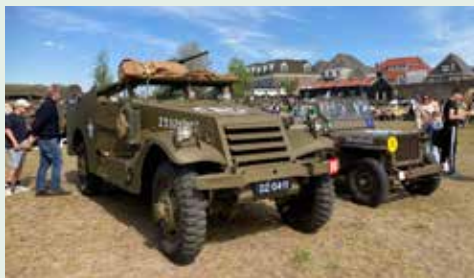
De bevrijdingscolonne vanwege 80 jaar bevrijding

De bevrijdingscolonne Noordwest-Veluwe trekt door Putten, Ermelo en Harderwijk.