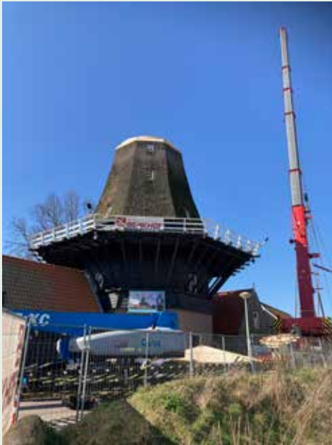
Molen De Hoop krijgt nieuw dak en nieuwe wieken

Molen De Hoop verkeert in acuut gevaar; de wieken en de kap van de molen zijn er slecht aan toe. Aalscholvers en hun uitwerpselen zijn de voornaamste oorzaak. De situatie is zo ernstig dat de Inspectie heeft geconstateerd dat deze niet meer veilig zijn en direct vervangen moeten worden.