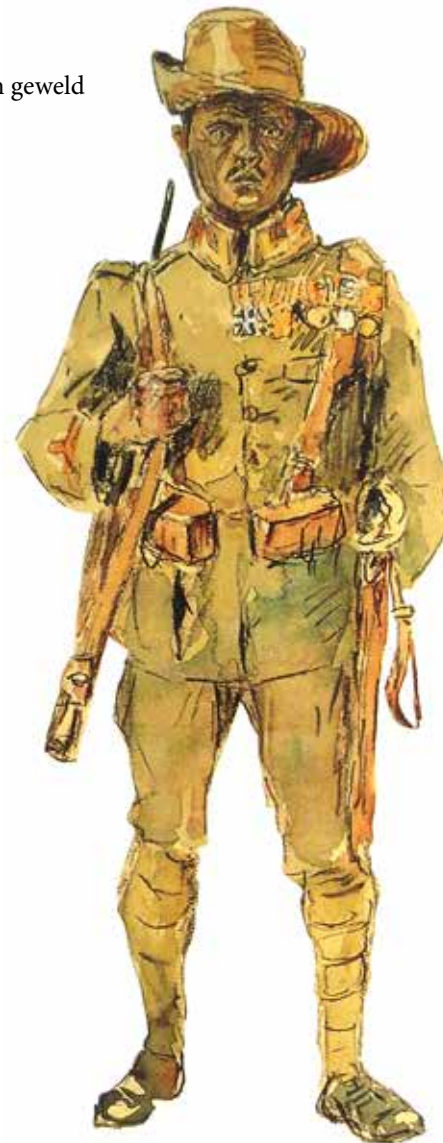
Fuselier met bepakking

Voorgedragen op 21 juni 2014 ter gelegenheid van het 200-jarige bestaan van het Koloniaal Werfdepot in Harderwijk