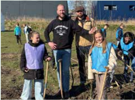
Boomplantdag 2025.

Tijdens de boomfeestdag planten 350 leerlingen van basisscholen 175 bomen op een perceel natuurontwikkeling achter bedrijventerrein Lorentz II en III.