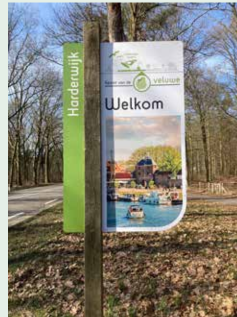
Veluwe aan Zee Noord en Zuid

Voortaan is het niet meer Strand Horst of Strand Nulde maar Veluwe aan Zee Noord en Zuid. De naamsverandering heeft te maken met een volledige herinrichting van het recreatiegebied tussen de A28 en de randmeren. In mei wordt het gebied officieel geopend.